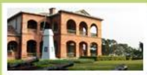
淡水紅毛城(聖多明哥城)