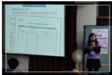
輔導團分享 益教網、訊息快遞與課綱轉化成果