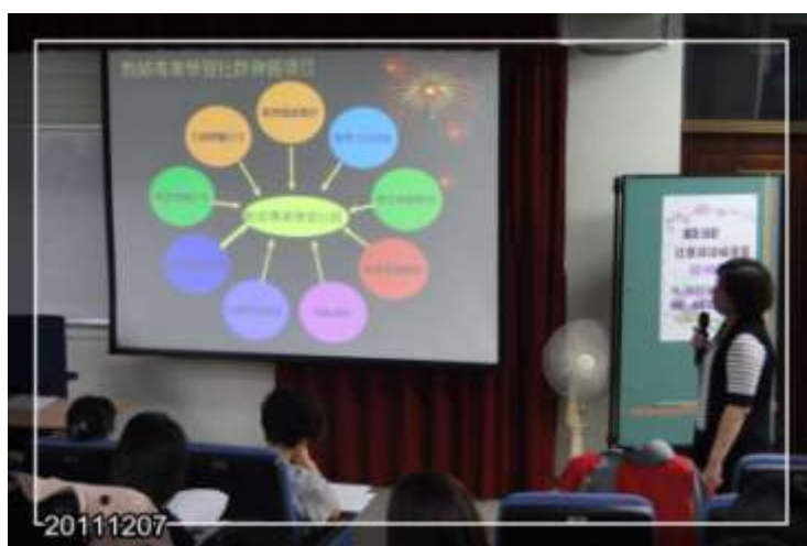
中山國中團隊 (報告人:楊雅智 老師)