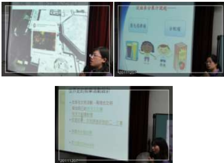
輔導團員分享教學小撇步