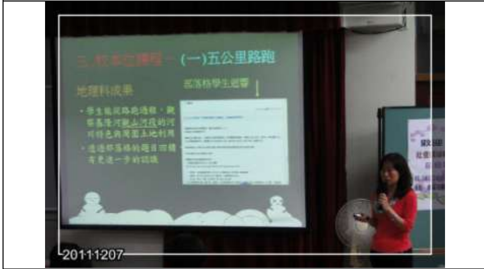
民生國中團隊 (報告人：葛淑貞 老師)