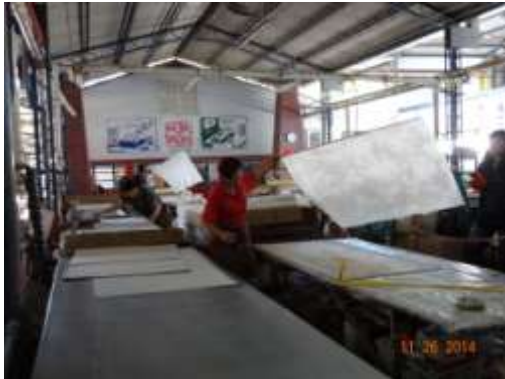
烘乾紙的步驟