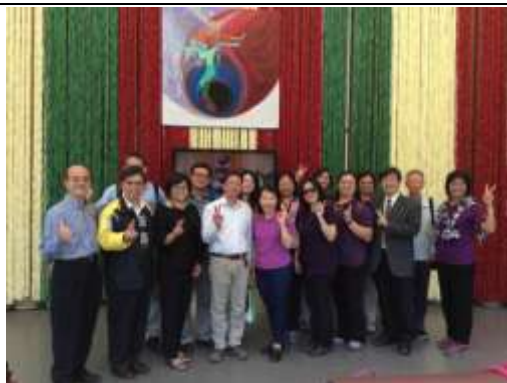
紙教堂內大合照