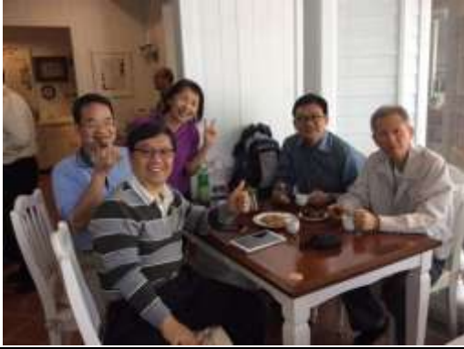
臺北市國中小一起學習