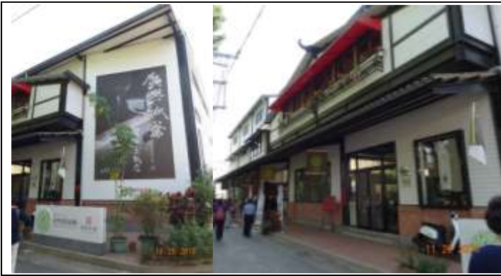
廣興紙寮