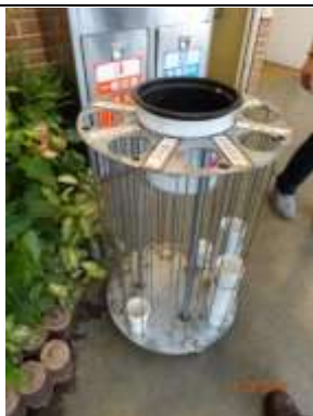
工房每一區都做好環保分類