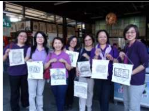
努力學習大豐收