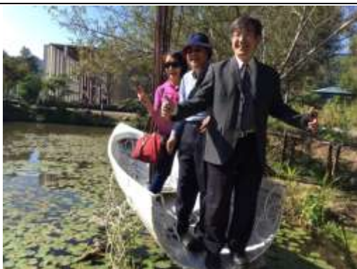
同舟共濟

坐落在青綠草坪上的「紙教堂」，教堂內部由五十八根高壓紙漿鑄造而成的立柱支撐起整個教堂，屋頂則覆蓋一層透光的天幕，外圍則是以成本較低的玻璃纖維浪板所構築成的長方形外牆，室內與室外的長管椅是由埔里所製造，因為紙也是埔里名產之一。其中在玻璃纖維外牆與立柱間巧妙的構成一個橢圓形空間的迴廊，以及當光線由透光的天幕射下，都讓人有一種莊嚴與神聖的氛圍。