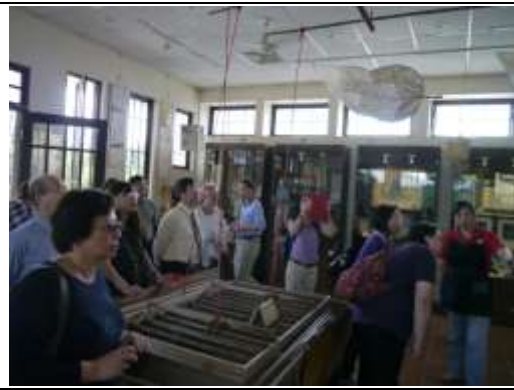
造紙過程解說