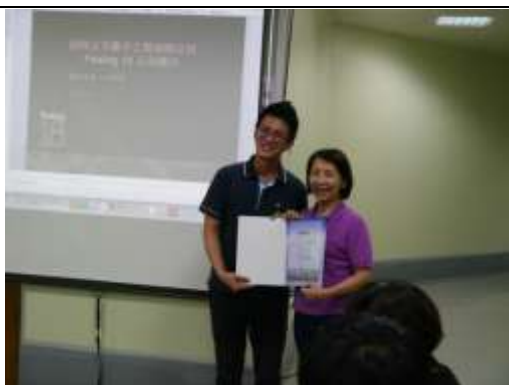
感謝接待與解說

為了埔里這塊土地，工房用心做很多事情。2011年，秉持著師師父「取之於社會，用之於社會」的信念，成立了18度C文化基金會，帶動南投的閱讀教育。