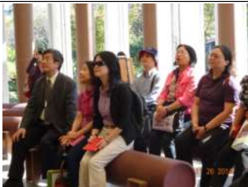
解說員黑麻糬精闢解說