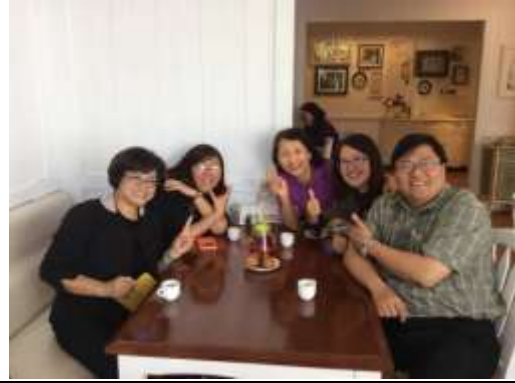
臺北市南投縣夥伴交流