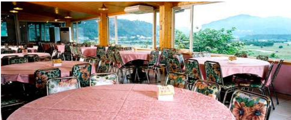
牛耳藝術渡假村官網 http://www.neweraart.com.tw/rest.asp

景觀餐廳位於牛耳藝術渡假村內，擁有 270 度無遮敞視野可讓您飽攬埔里田園自然美景，在餐廳內仿若置身草木扶疏的庭園中，享受充滿悠閒的氣氛及品嚐埔里特殊的野菜風味。