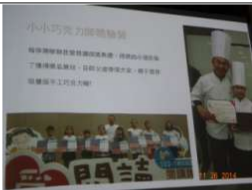
從我愛閱讀到小小巧克力師