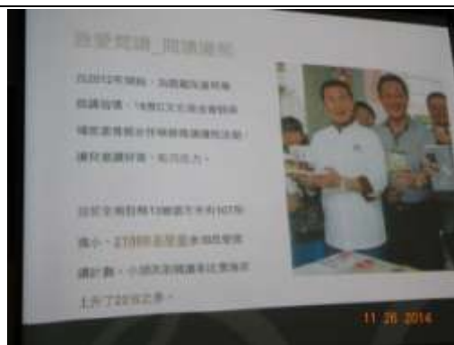
從巧克力到閱讀護照