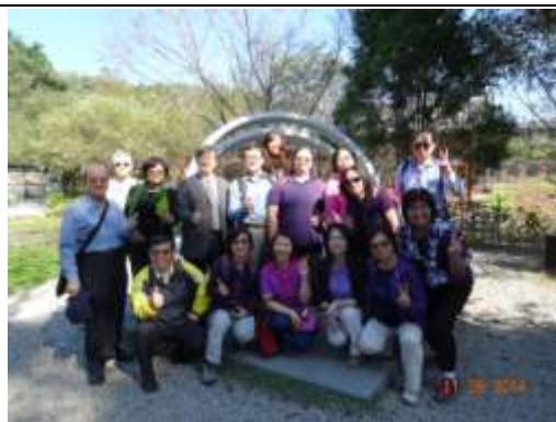
互相扶持