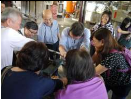
同心協力轉緊將水份押出