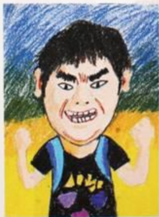
王奕涵 / 我的好朋友 / 粉蠟筆 / 38×29公分