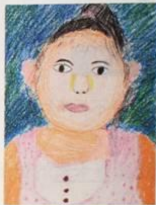
吳奕瑩 / 我的好朋友 / 粉蠟筆 / 38×29公分