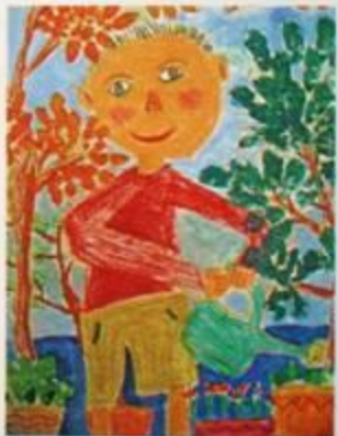
陳宥良 / 我的好朋友 / 水彩、粉蠟筆 / 38×29公分