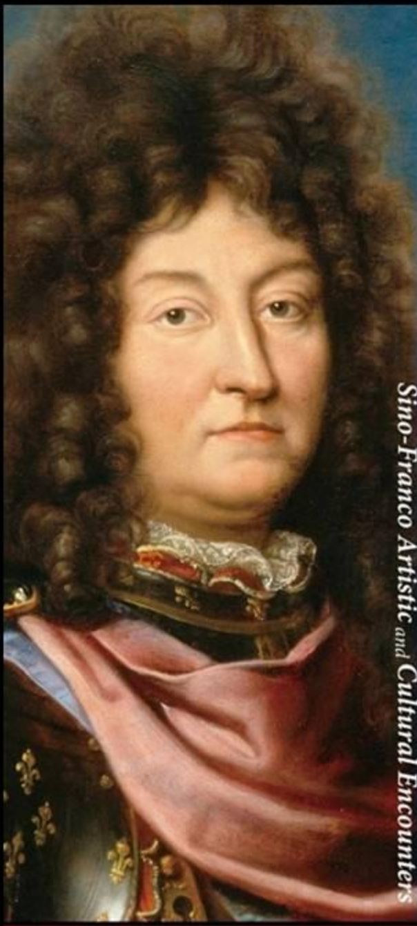
Sino-Franco Artistic and Cultural Encounters