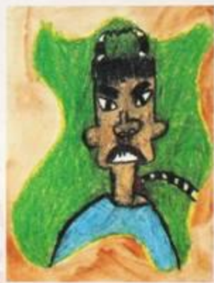
葛浩哲 / 我的好朋友 / 粉蠟筆 / 38×29公分