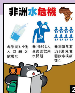
圖 5-1 漫畫圖