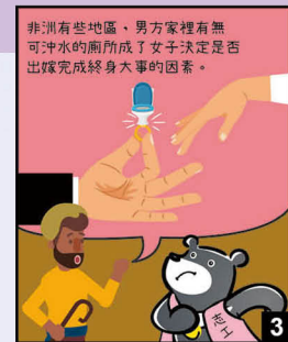
圖 5-2 漫畫圖