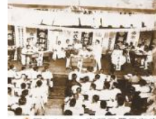
▲圖2-3-15 臺灣民眾黨在臺南召開大會的情景。