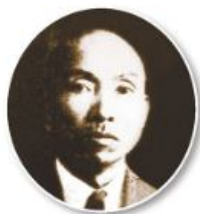
▲圖2-3-12 林獻堂像／林獻堂，臺中市霧峰區人，是日治時期政治社會運動的主要領導人之一。