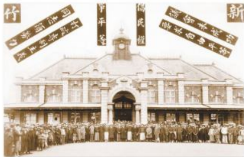
▲圖2-3-11 臺灣議會設置請願運動／圖為1929年，該運動成員前往東京請願前，於新竹火車站前的合影。

當臺灣議會設置請願運動展開後，林獻堂、蔣渭水等人也於1921年成立「臺灣文化協會」，其宗旨為「謀臺灣文化之向上」，積極推行各項啓迪民智的工作，例如：發行臺灣民報、設立讀報社及舉辦演講會等，在喚醒民族意識及改良社會風氣等方面，均有相當大的貢獻（圖2-3-13~14）。