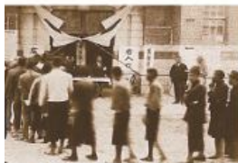
▲圖2-3-16 地方議員選舉／臺灣第一次進行選舉，是在日治時期。圖為1935年，臺中市議員選舉現場。