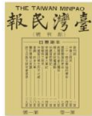
▲圖2-3-13 臺灣民報副刊號