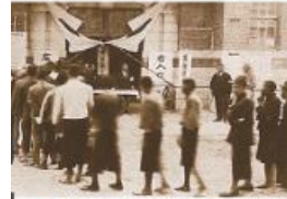
▲圖2-3-16 地方議員選舉／臺灣第一次進行選舉，是在日治時期。圖為1935年，臺中市會議員選舉現場。