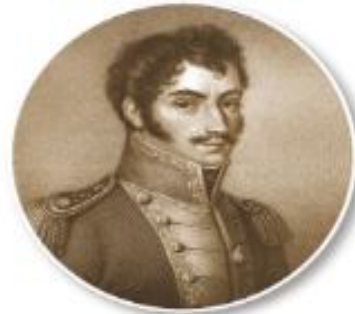
▲圖2-1-2 玻利瓦像／玻利瓦是推動拉丁美洲各國獨立的重要人物。玻利維亞共和國便是以他的名字來命名的。

民族主義是指民族與國家的關係密不可分，主張一個民族建立一個國家，增進民族的利益。