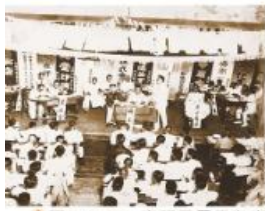
▲圖2-3-15 臺灣民眾黨在臺南召開大會的情景。