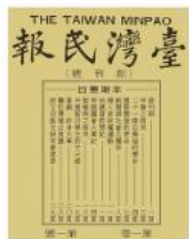
▲圖2-3-13 臺灣民報副刊號