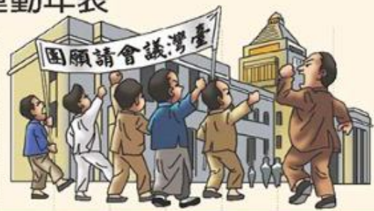
臺灣議會設置請願運動 (1921~1934)