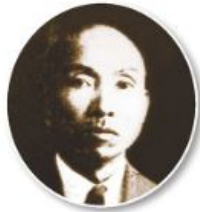
▲圖2-3-12 林獻堂像／林獻堂，臺中市霧峰區人，是日治時期政治社會運動的主要領導人之一。