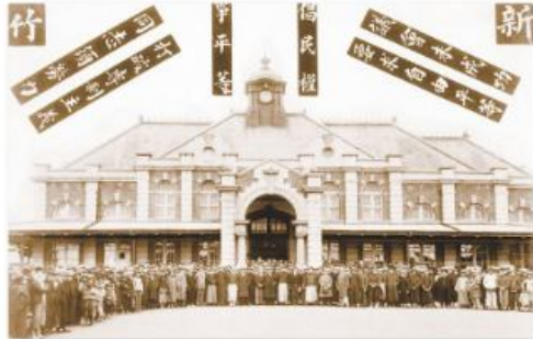
▲圖2-3-11 臺灣議會設置請願運動／圖為1929年，該運動成員前往東京請願前，於新竹火車站前的合影。

當臺灣議會設置請願運動展開後， 林獻堂 、 蔣渭水 等人也於1921年成立「臺灣文化協會」，其宗旨為「謀臺灣文化之向上」，積極推行各項啓迪民智的工作，例如：發行 臺灣民報 、設立讀報社及舉辦演講會等，在喚醒民族意識及改良社會風氣等方面，均有相當大的貢獻（圖2-3-13~14）。