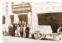
▲圖2-3-14 臺灣民報總社發處/蔣渭水的大安醫院(位於今臺北市延平北路)不僅是發售臺灣民報的地方，也是臺灣文化協會的會址。