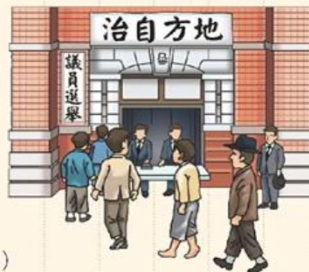
臺灣地方自治聯盟 (1930~1937)