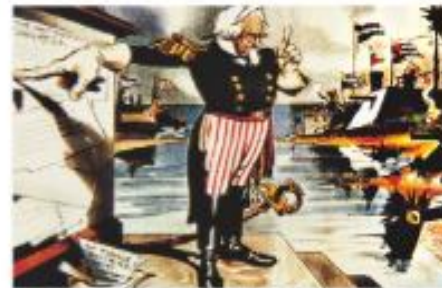
▲圖2-1-3 門羅宣言漫畫／圖中門羅指著看板上的宣言，聲明拒絕歐洲列強介入美洲事務。