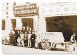
▲圖2-3-14 臺灣民報總批發處／蔣渭水的大安醫院（位於今臺北市延平北路）不僅是發送臺灣民報的地方，也是臺灣文化協會的會址。