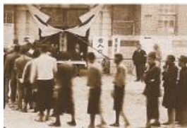
▲圖2-3-16 地方議員選舉／臺灣第一次進行選舉，是在日治時期。圖為1935年，臺中市會議員選舉現場。