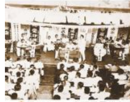
▲圖2-3-15 臺灣民眾黨在臺南召開大會的情景。