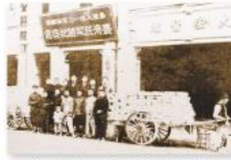
▲圖2-3-14 臺灣民報總批發處／蔣渭水的大安醫院（位於臺北市延平北路）不僅是發送臺灣民報的地方，也是臺灣文化協會的會址。