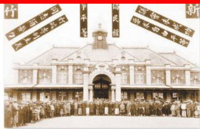
▲圖2-3-11 臺灣議會設置請願運動。圖為1929年，該運動成員前往東京請願前，於新竹火車站前的合影。

當臺灣議會設置請願運動展開後，林獻堂、蔣渭水等人也於1921年成立「臺灣文化協會」，其宗旨為「謀臺灣文化之向上」，積極推行各項啓迪民智的工作，例如：發行臺灣民報、設立讀報社及舉辦演講會等，在喚醒民族意識及改良社會風氣等方面，均有相當大的貢獻(圖2-3-13~14)。