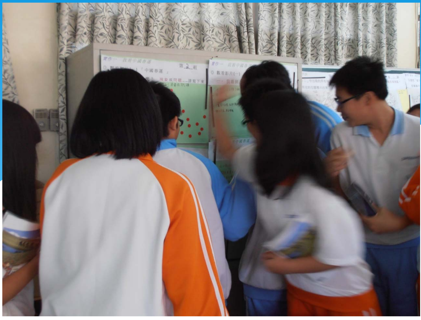
將代表「讚」的貼紙給認為最好的實作