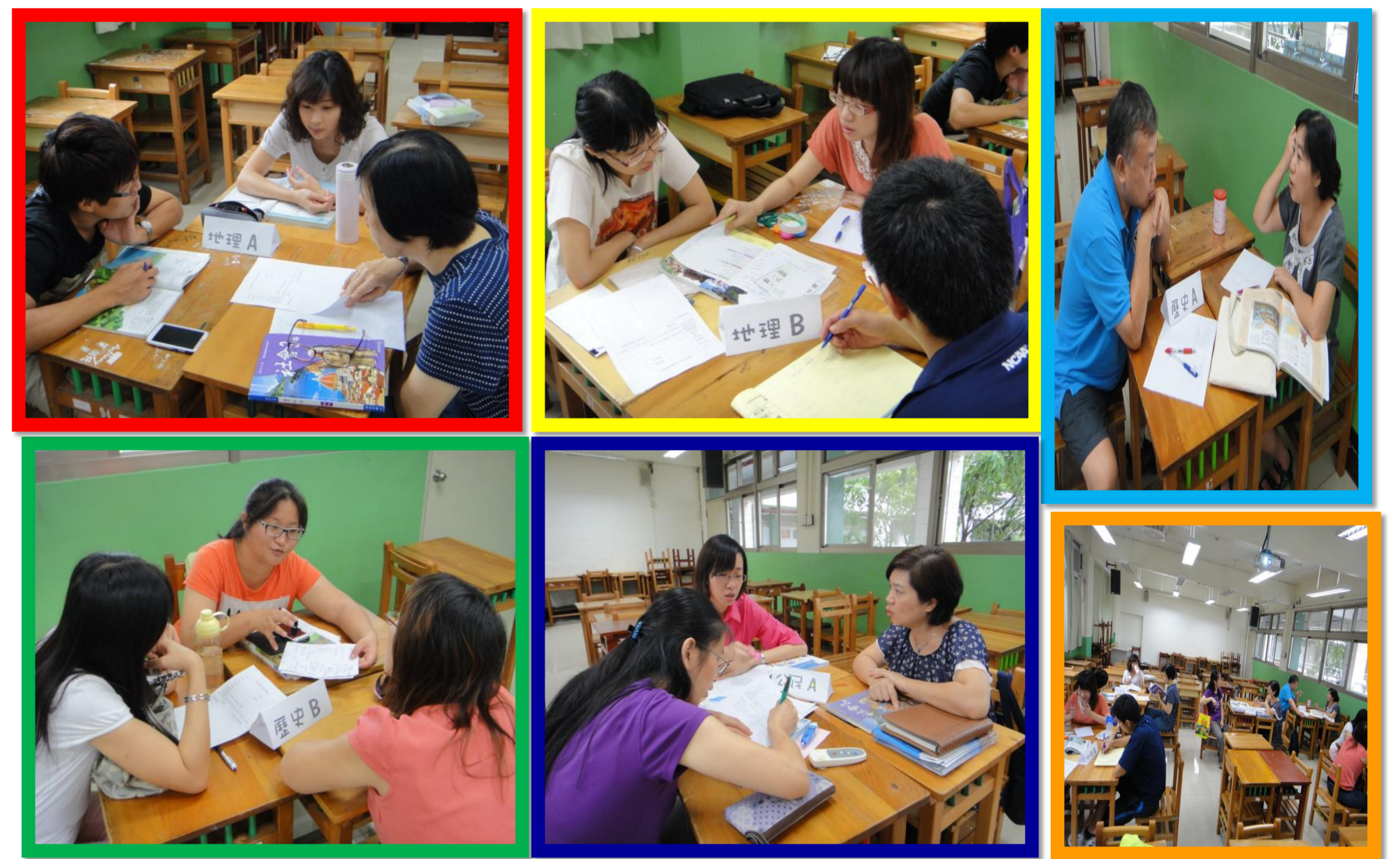
圖二、教師分組實施共同備課

將夥伴依科目分組，每組2~3人，以一個教學單元為中心，大家一起設計課程，共同構思教學方法和策略。夥伴對於活動都能積極參與、分擔責任，表現互助合作的行動。