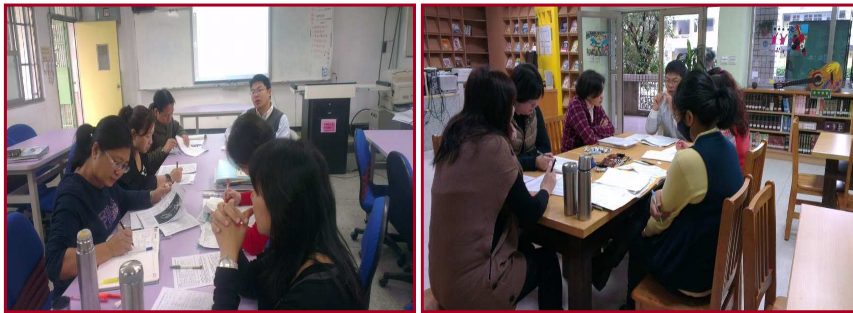
圖一. 以P L C運作模式，提升教師專業對話與課程活化知能