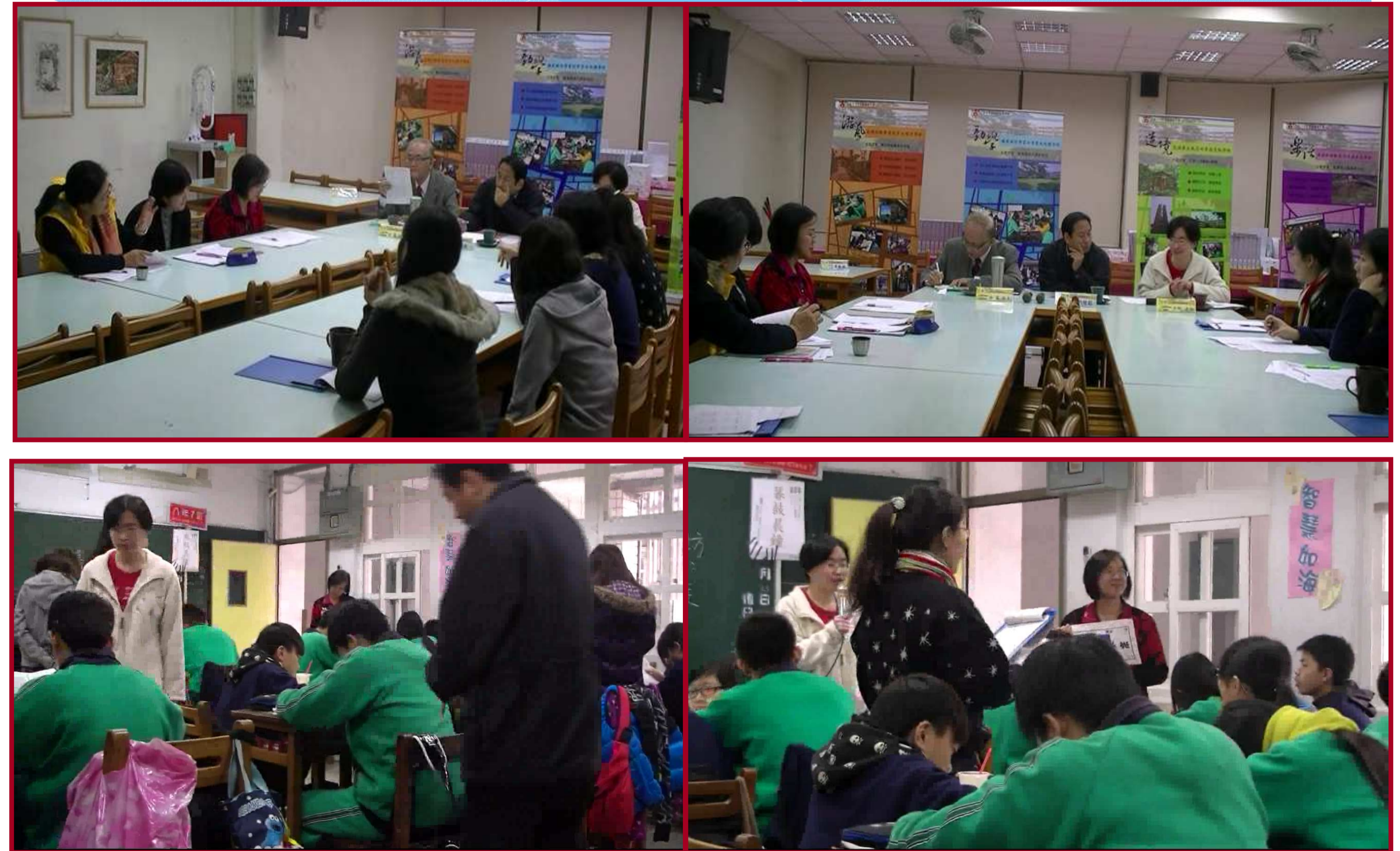
圖三. 《校內觀課》歷史科 學習共同體模式進行教學