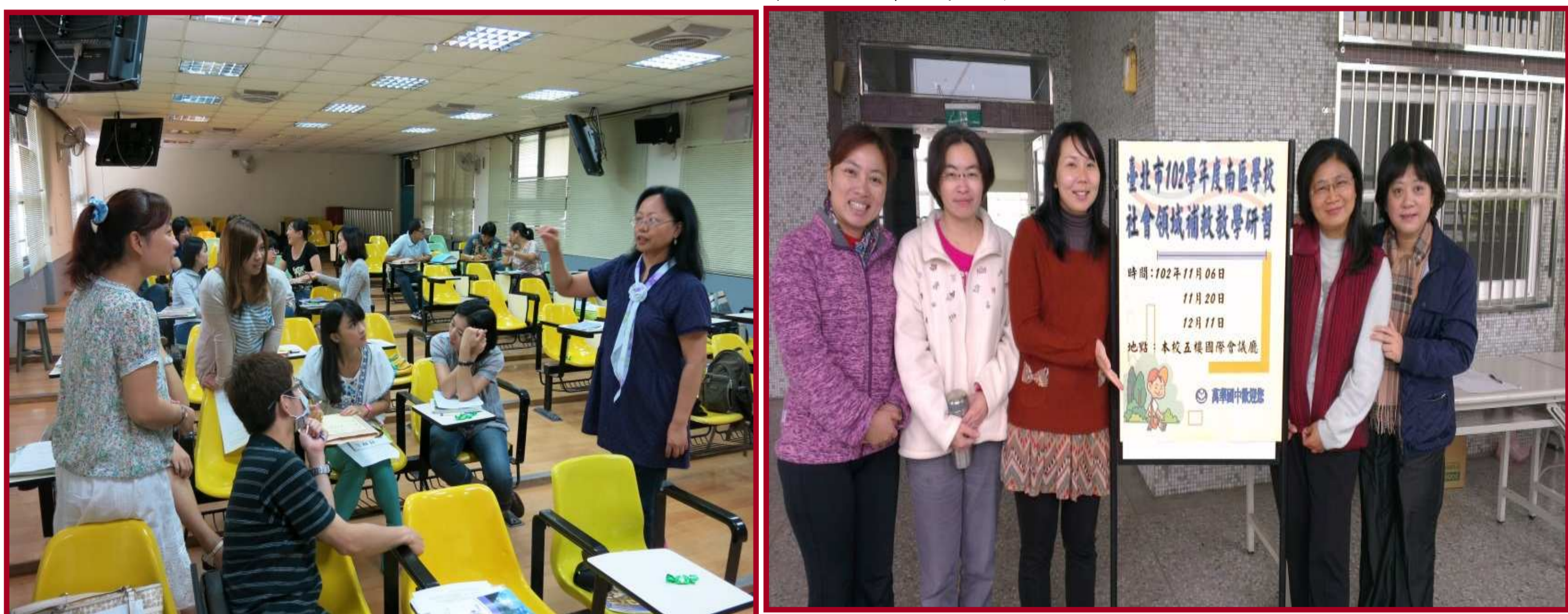
圖二. 跨校與增能研習，教師跨區分享增加交流與專業成長