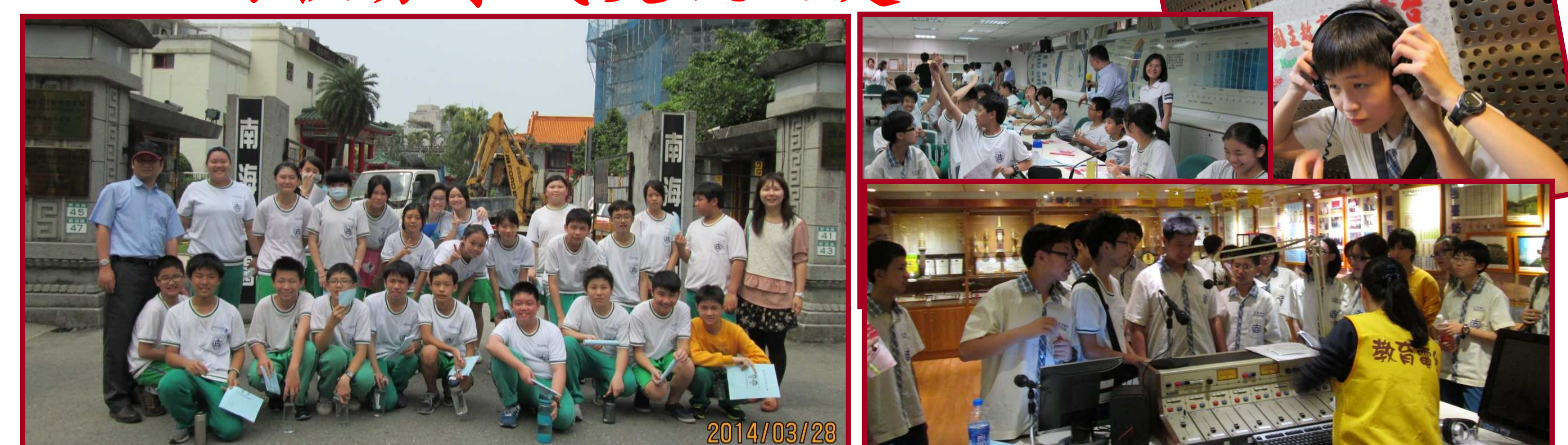
圖六. 學校本位課程-【教育電台】探訪活動