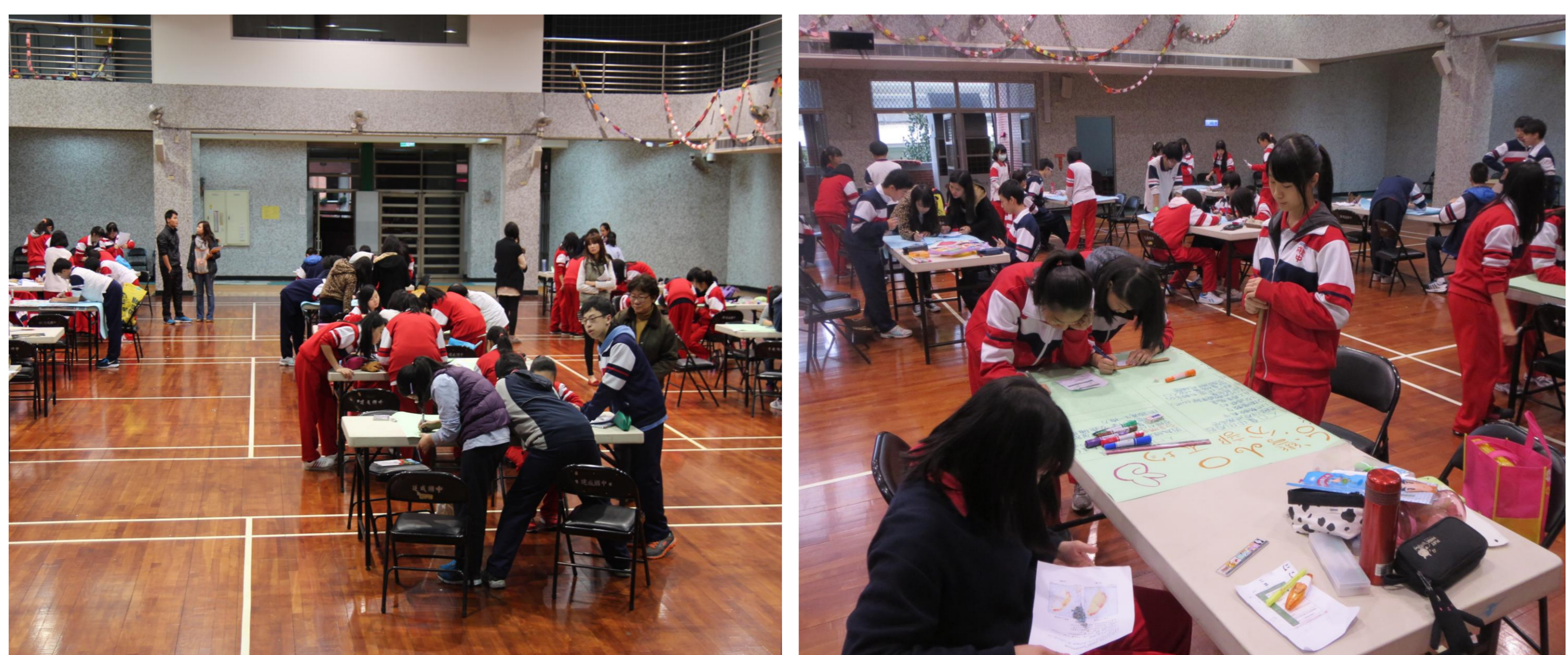
圖1. 102學年度第一回合競賽—學生現場製作海報