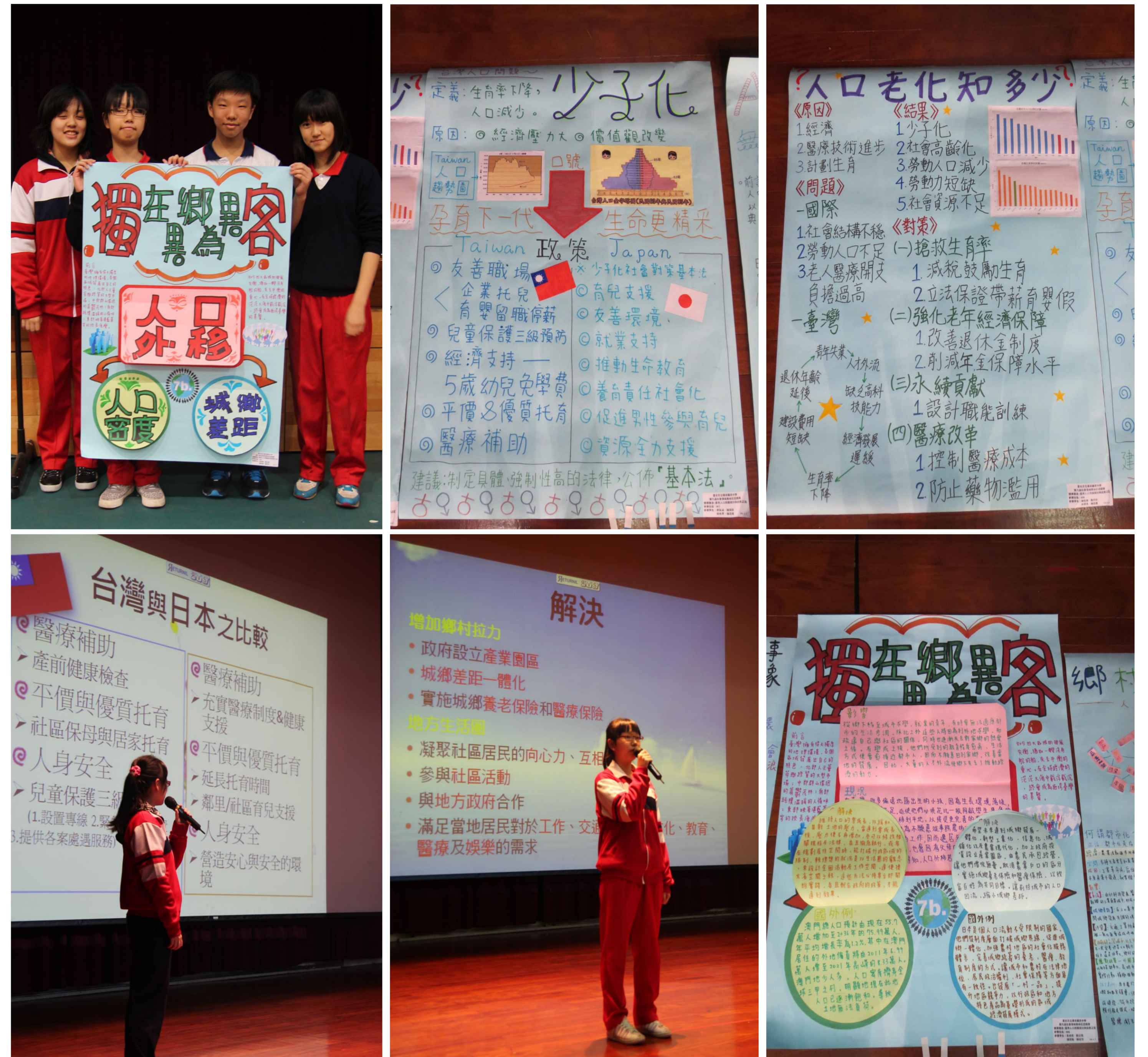
圖2. 102學年度第二回合競賽—上台發表與入選作品

由於比賽作品以海報的方式呈現，學生除需具備廣泛蒐集資料的能力外，資料整合後更要藉由排版和美工於有限的版面中突顯出主題重點，並於兩節課內限時完成，考驗學生資料彙整與組織架構的能力。在連續九年的比賽中，學生都能發揮創意與巧思，透過小組分工與團隊合作，完成令人驚豔的作品。