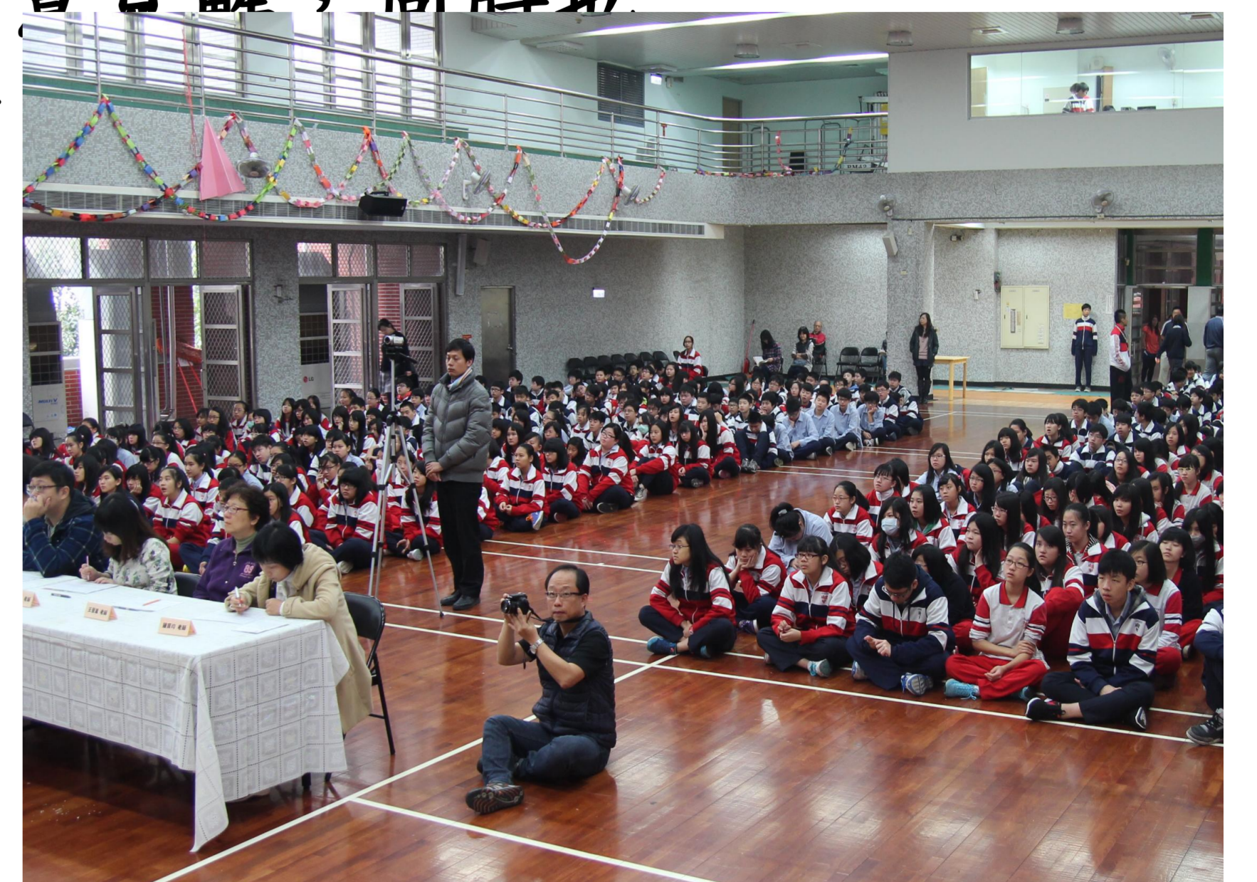
圖3. 七、八年級全體同學觀摩發表

社會領域教師往往因授課時數有限，在進度壓力下，多半採取講述教學法，學生僅能被動聽講。透過海報競賽活動，使學生能自主運用課堂中所習得的知識，學習擷取正確且有用的資料，進一步重組、統整訊息。另外，為增進學生的口語表達能力，第二回合採上台發表的方式，訓練學生大方論述己見，並針對議題提出具建設性的創意目解，同時也讓台下的學生進行觀摩，提升全體同學的參與度。我們發現—只要給學生盡情發揮的舞台，學生就能有出超乎你我想像的創意表現。