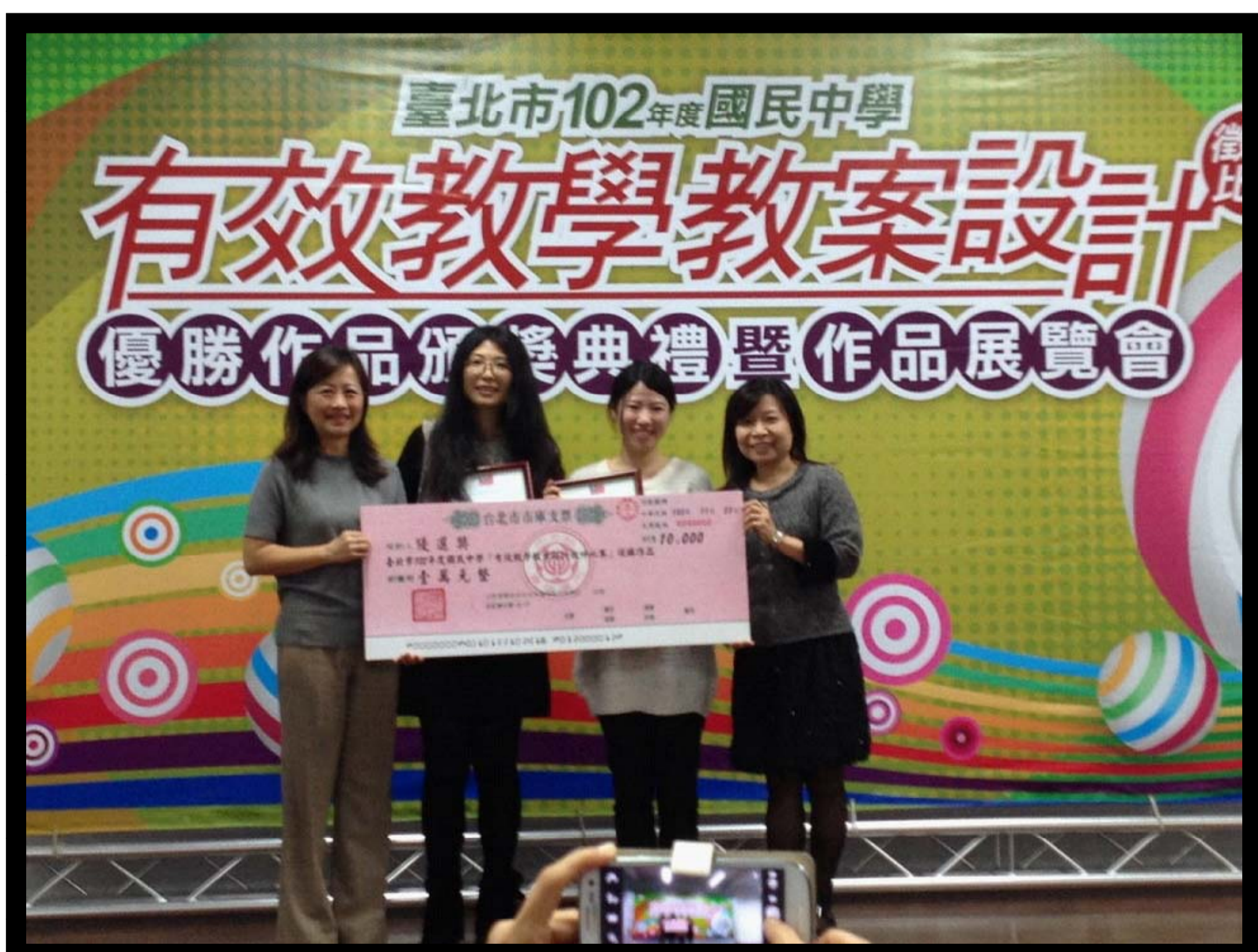
圖. 臺北市有效教學教案設計第二名