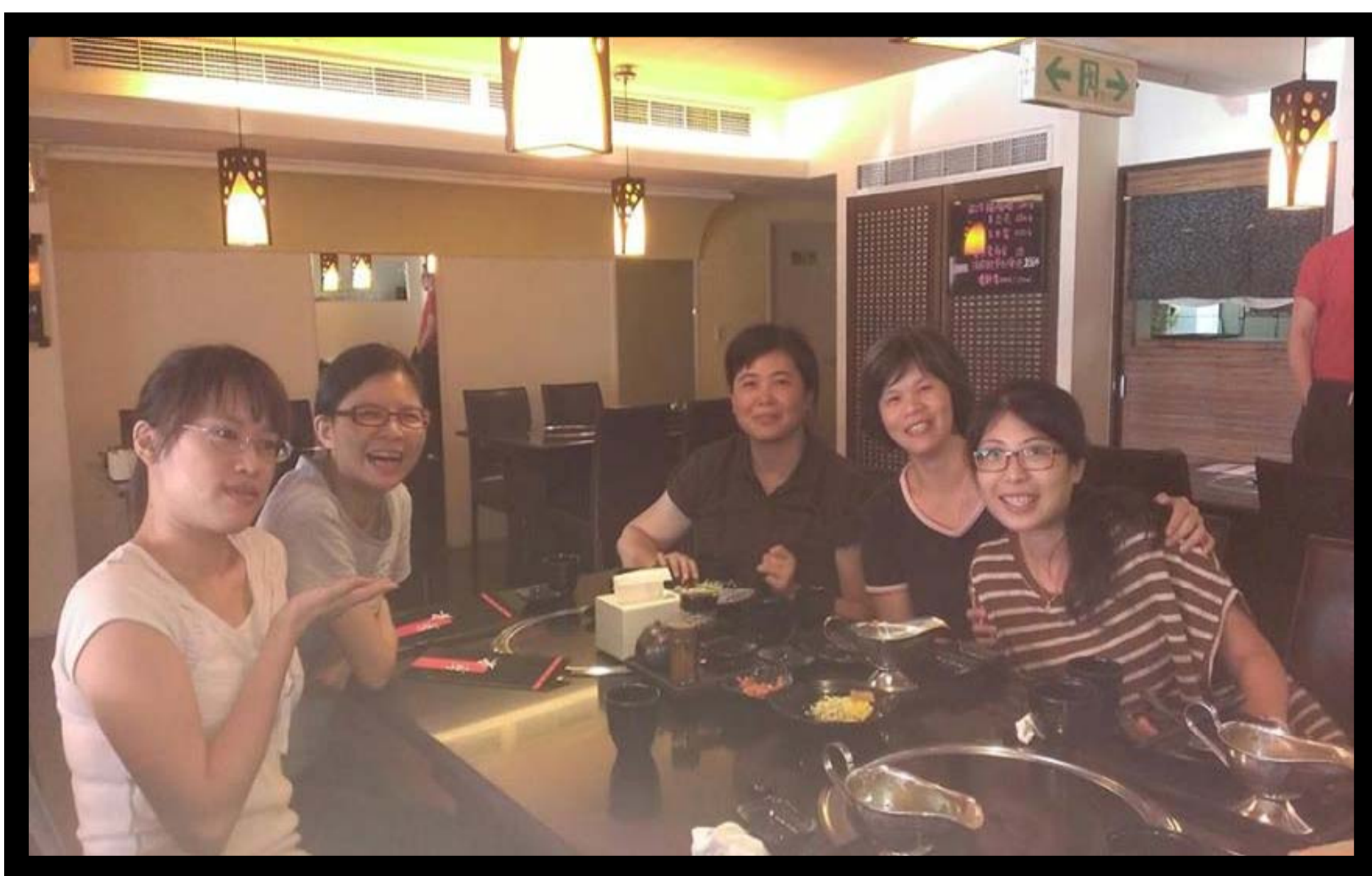
圖. 討論學生狀況掌握班級經營