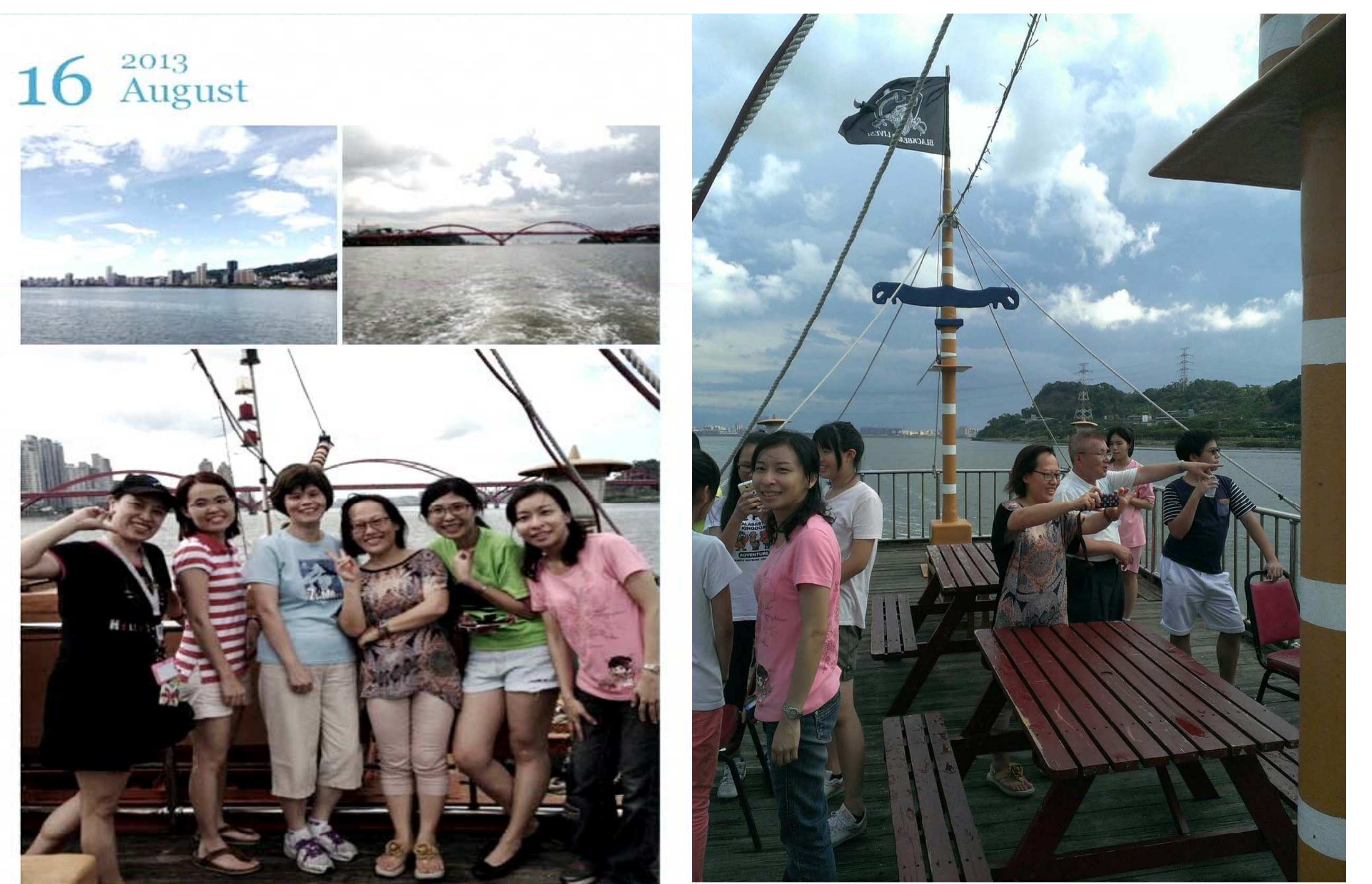
圖. 以大自然為教室，親臨現場聽解說