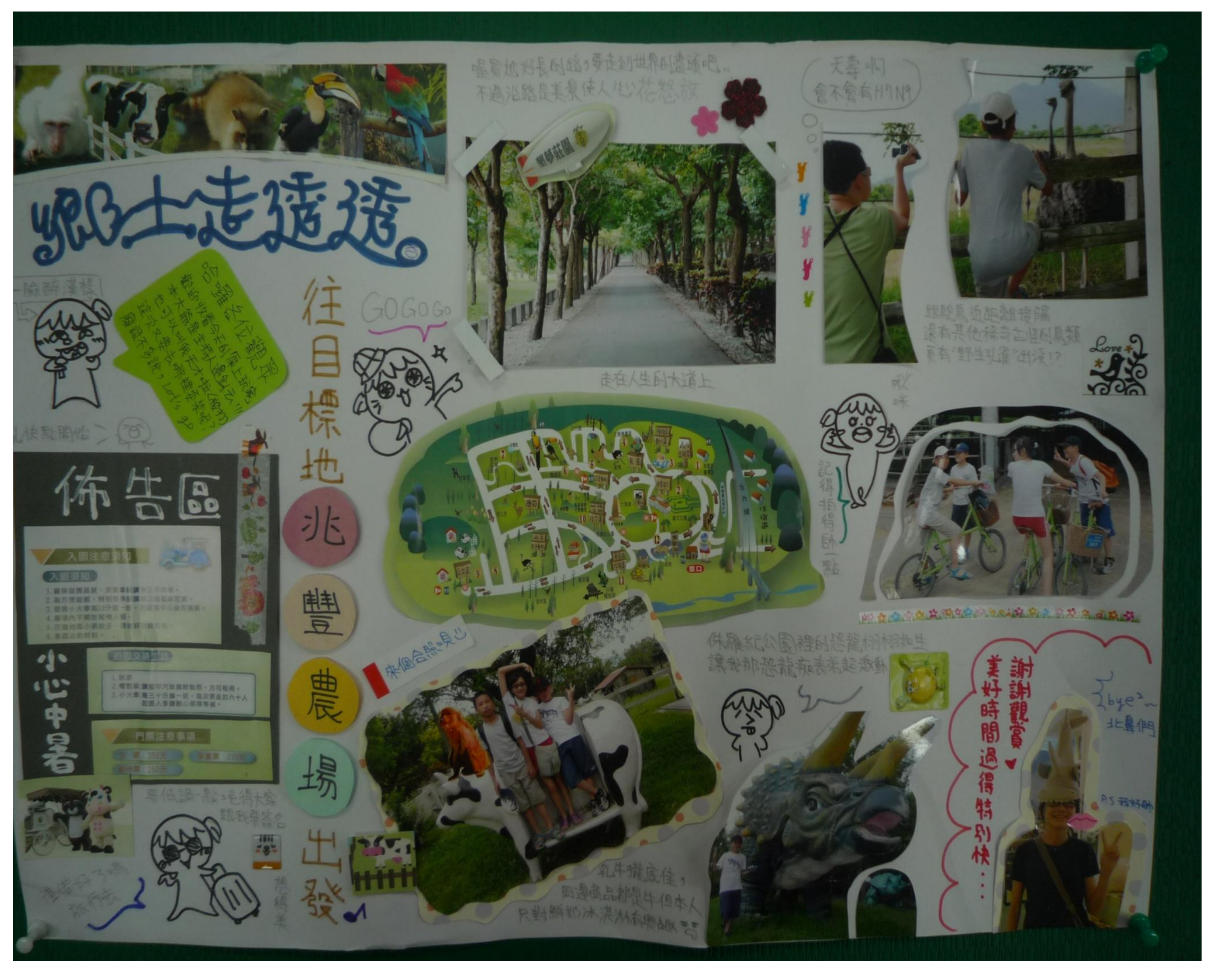
圖三。學生化身成小記者介紹臺灣的景點。