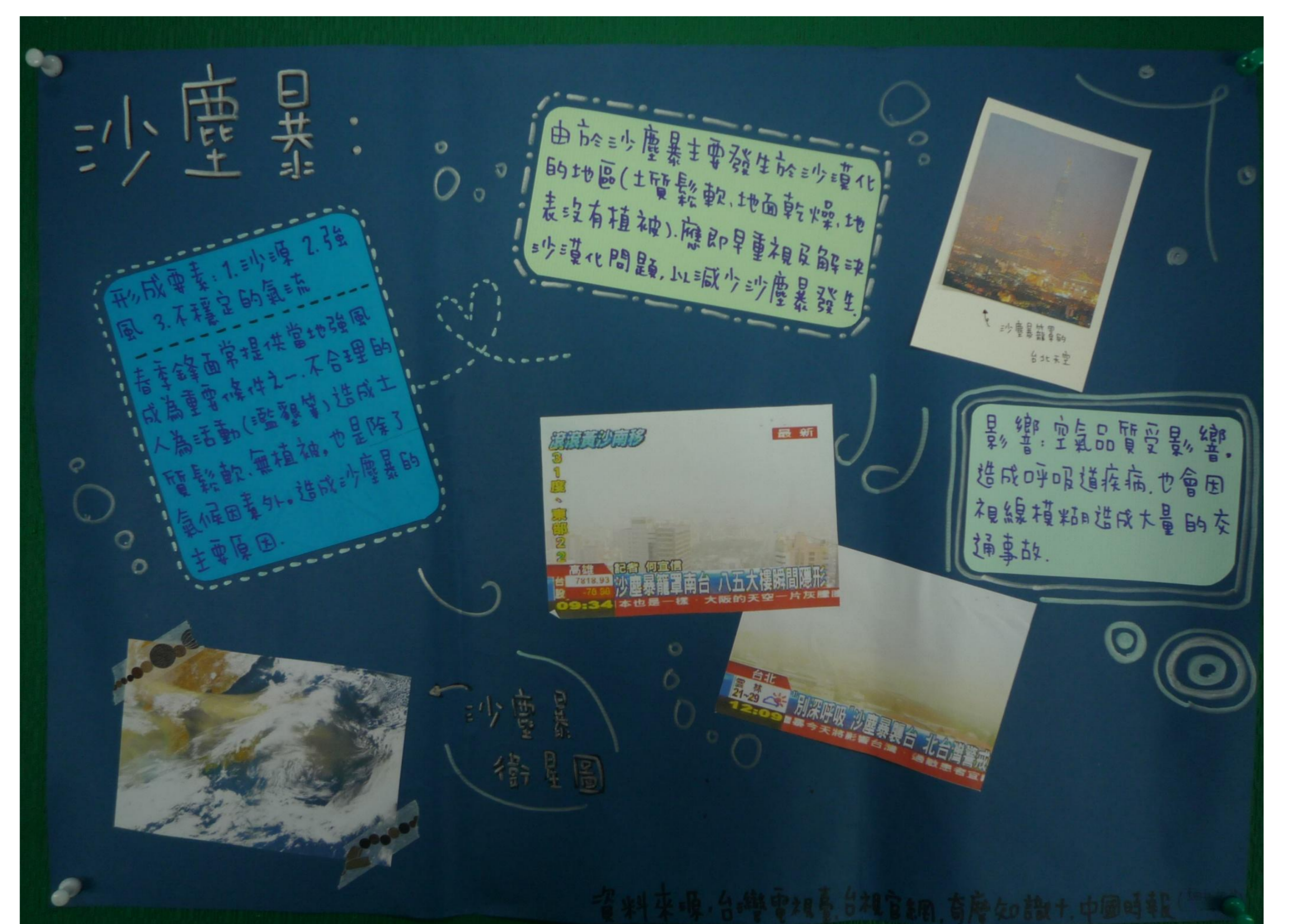
圖四。分析沙塵暴議題，關懷我們的地球環境。