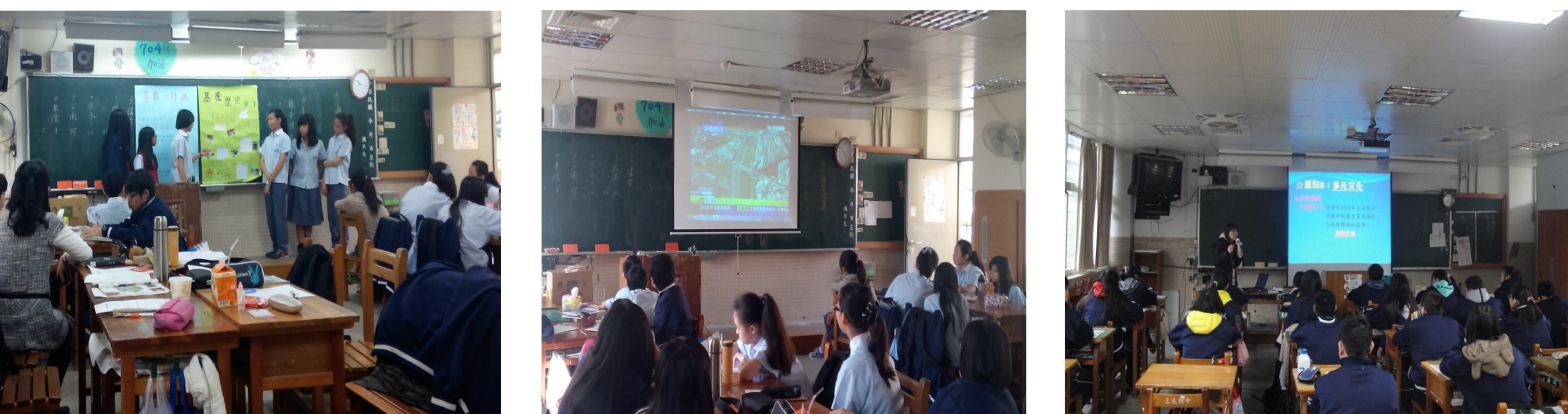
圖二、有效教學實施情形