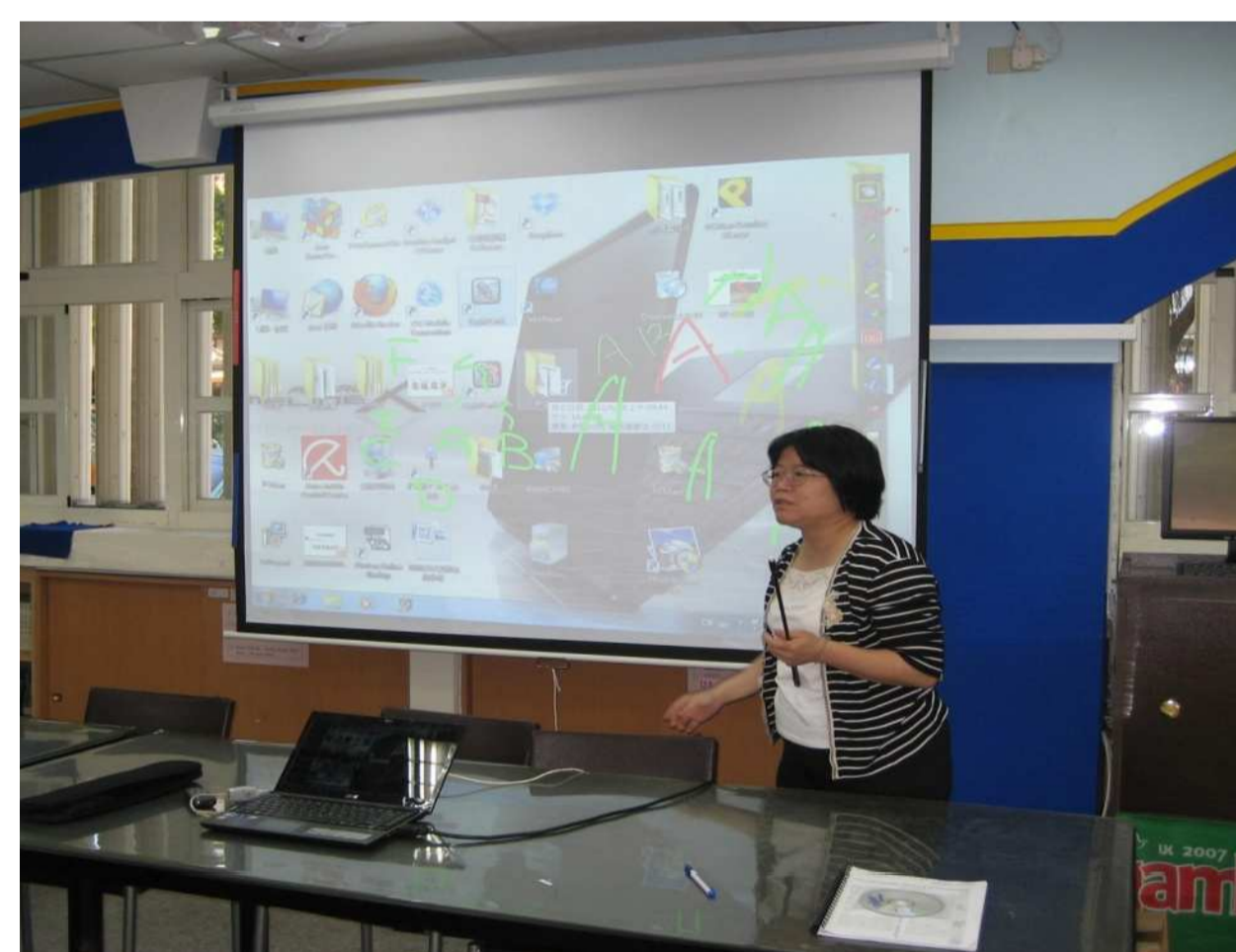
學習資訊科技融入教學