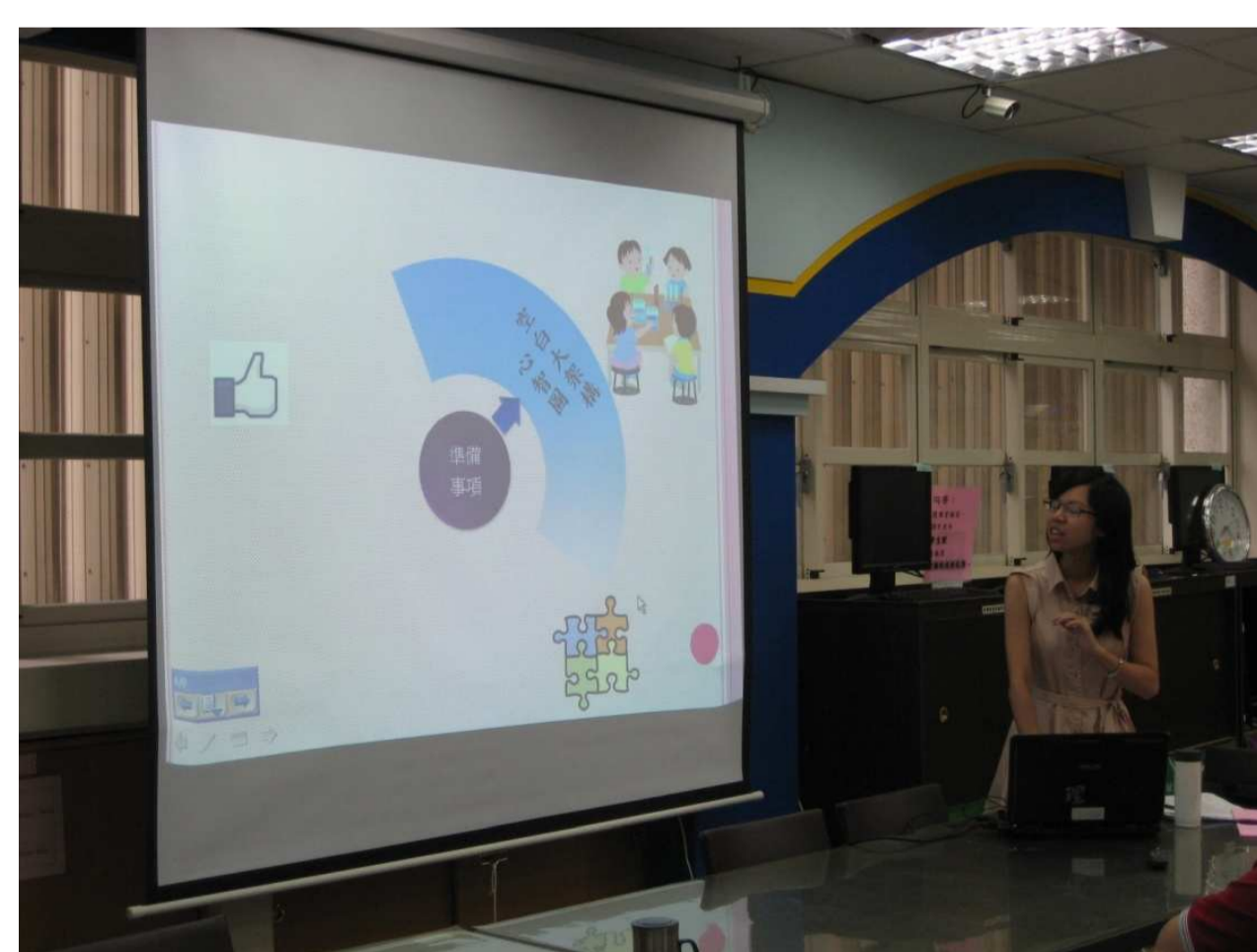
領域教師共同備課，分享好用的教學設計