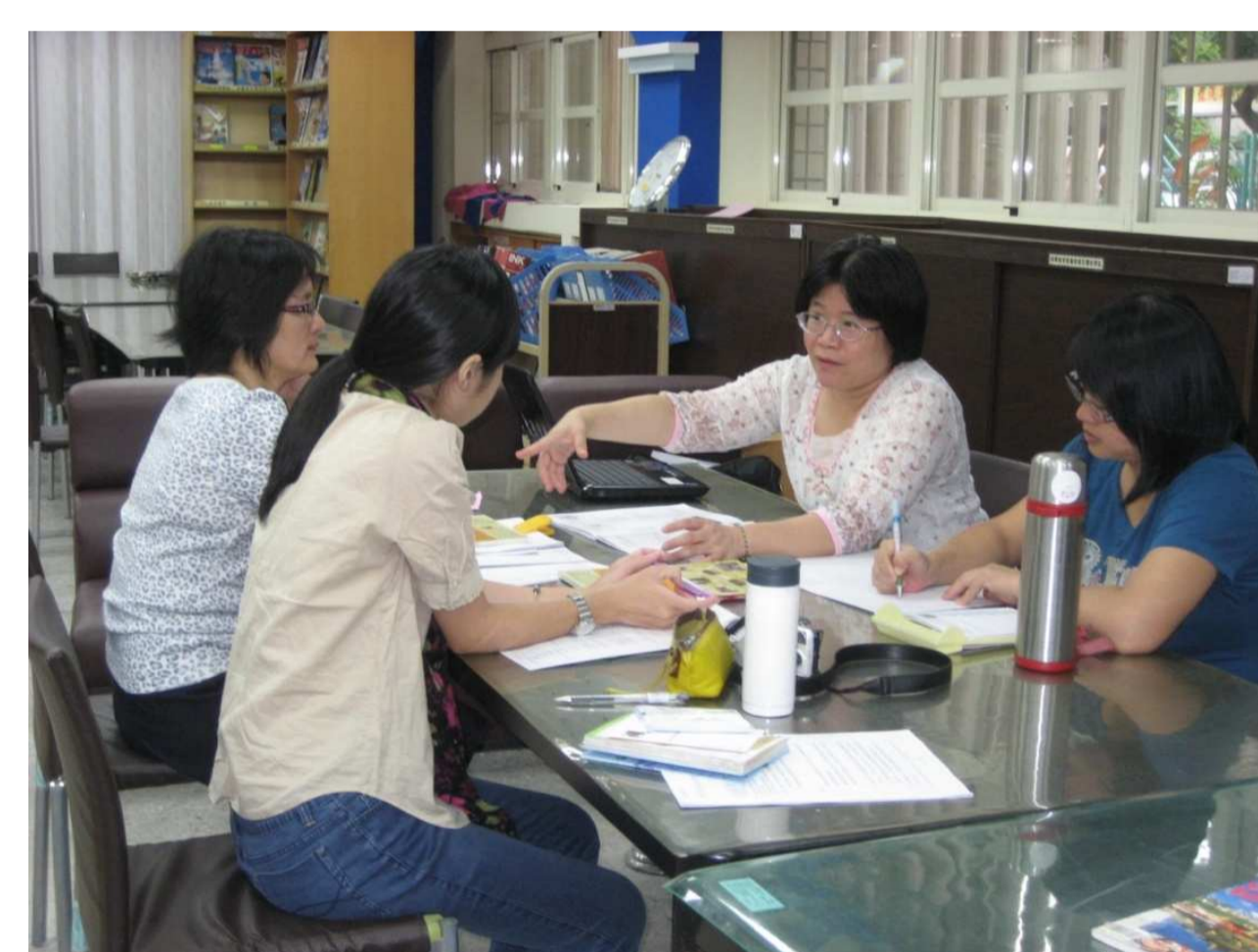
同領域師長共同備課、共同學習與成長