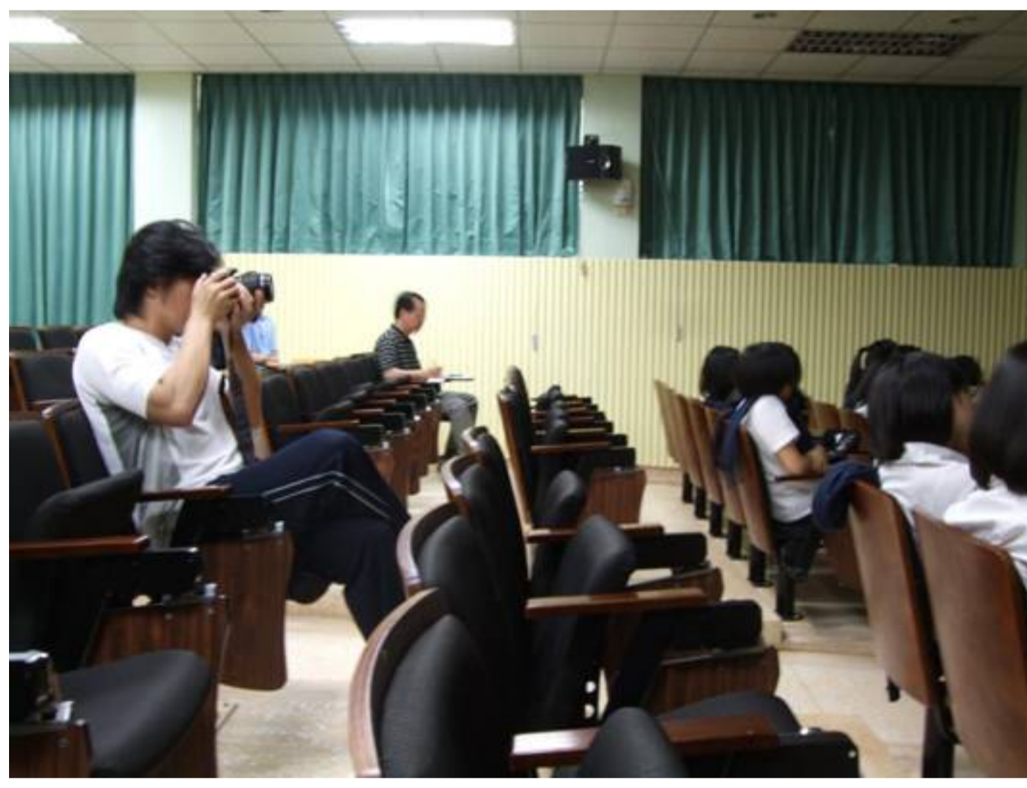
攝影課：老師、學生都在學