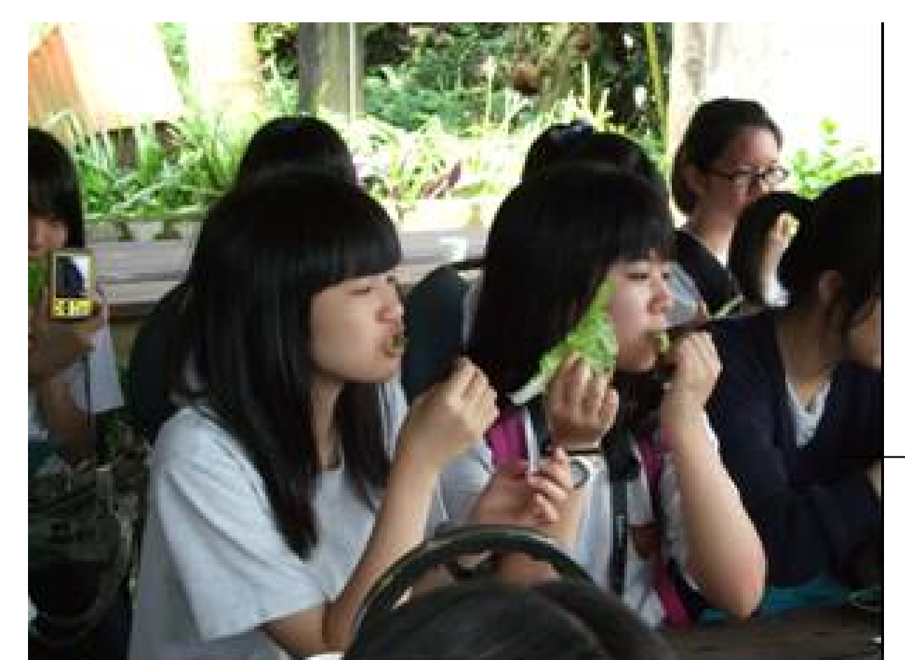
大家開心品嚐有機菜