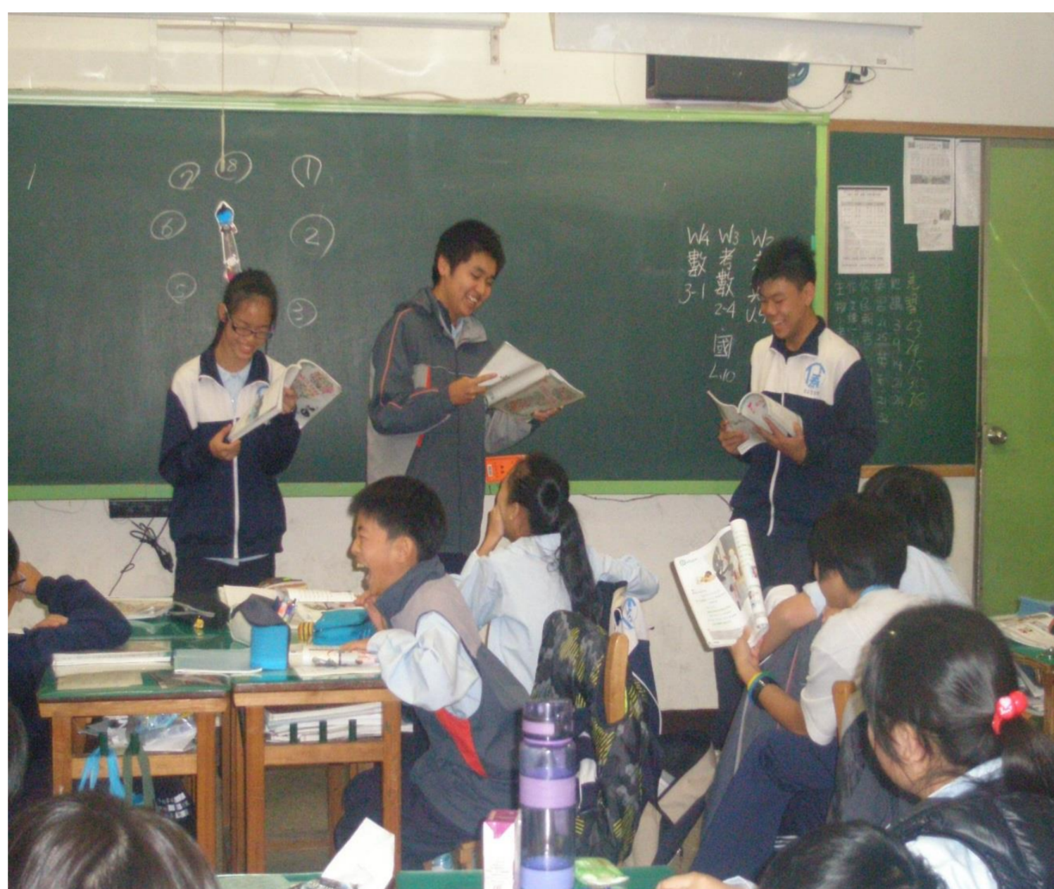
學生上台演示對話，逗笑全班