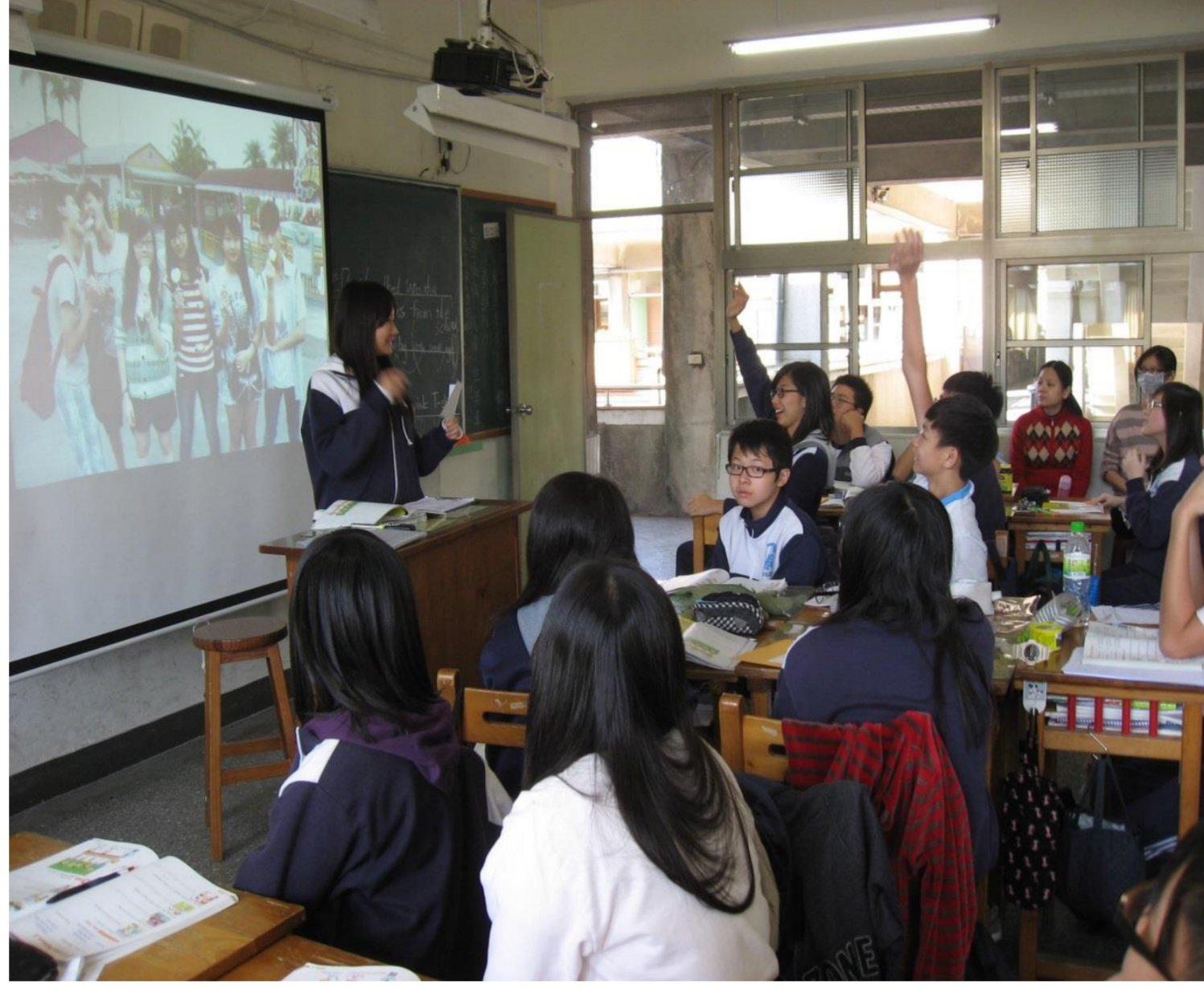
學生舉手搶答同學的問題