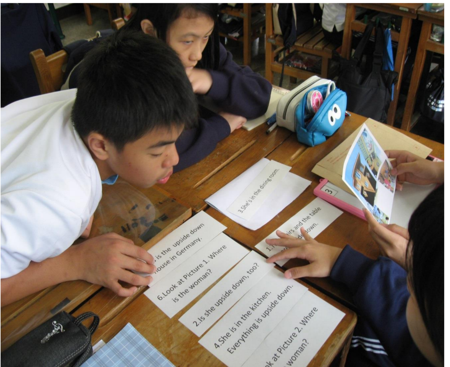
學生合作完成句子拼圖