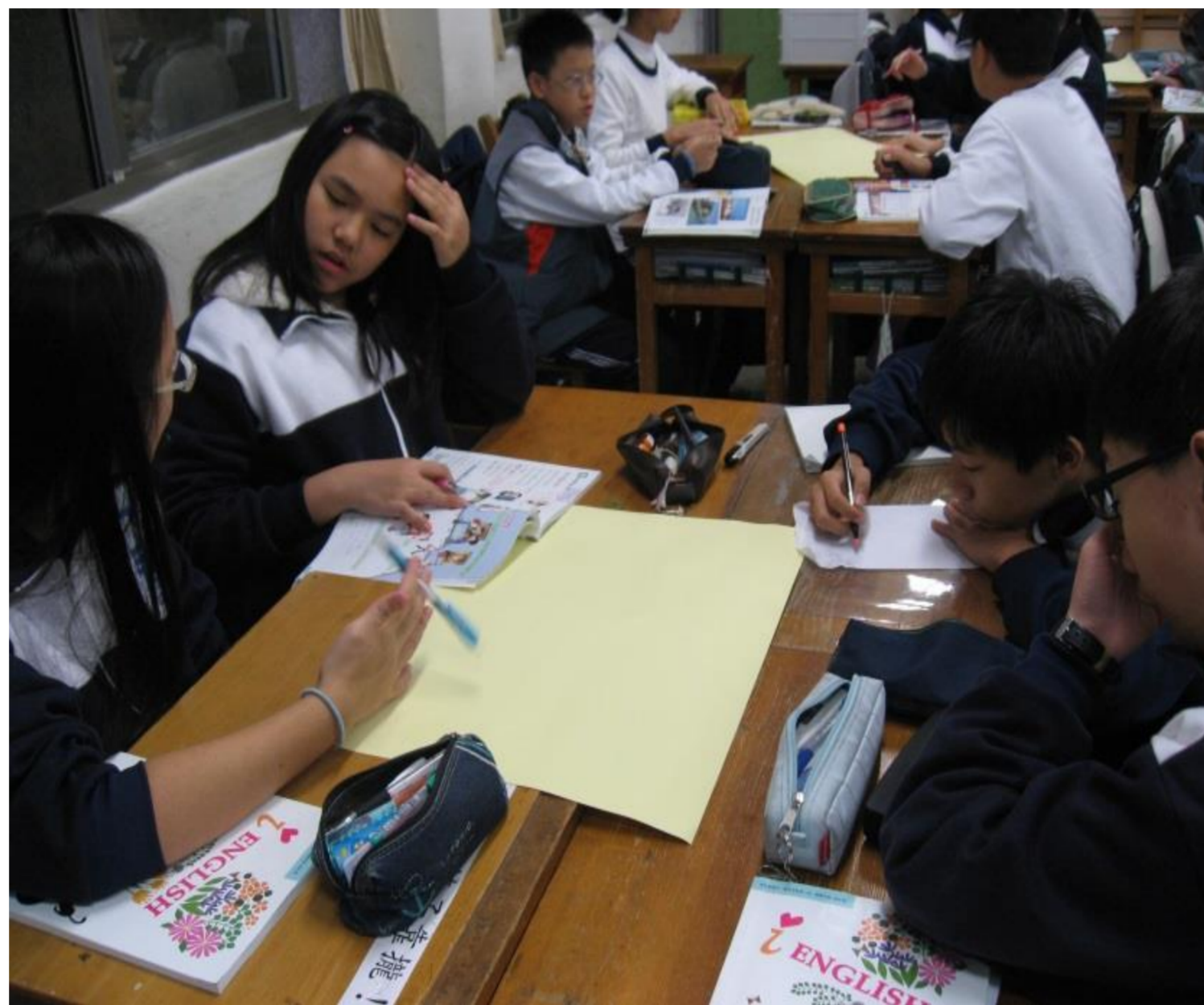
學生合作腦力激盪完成海報