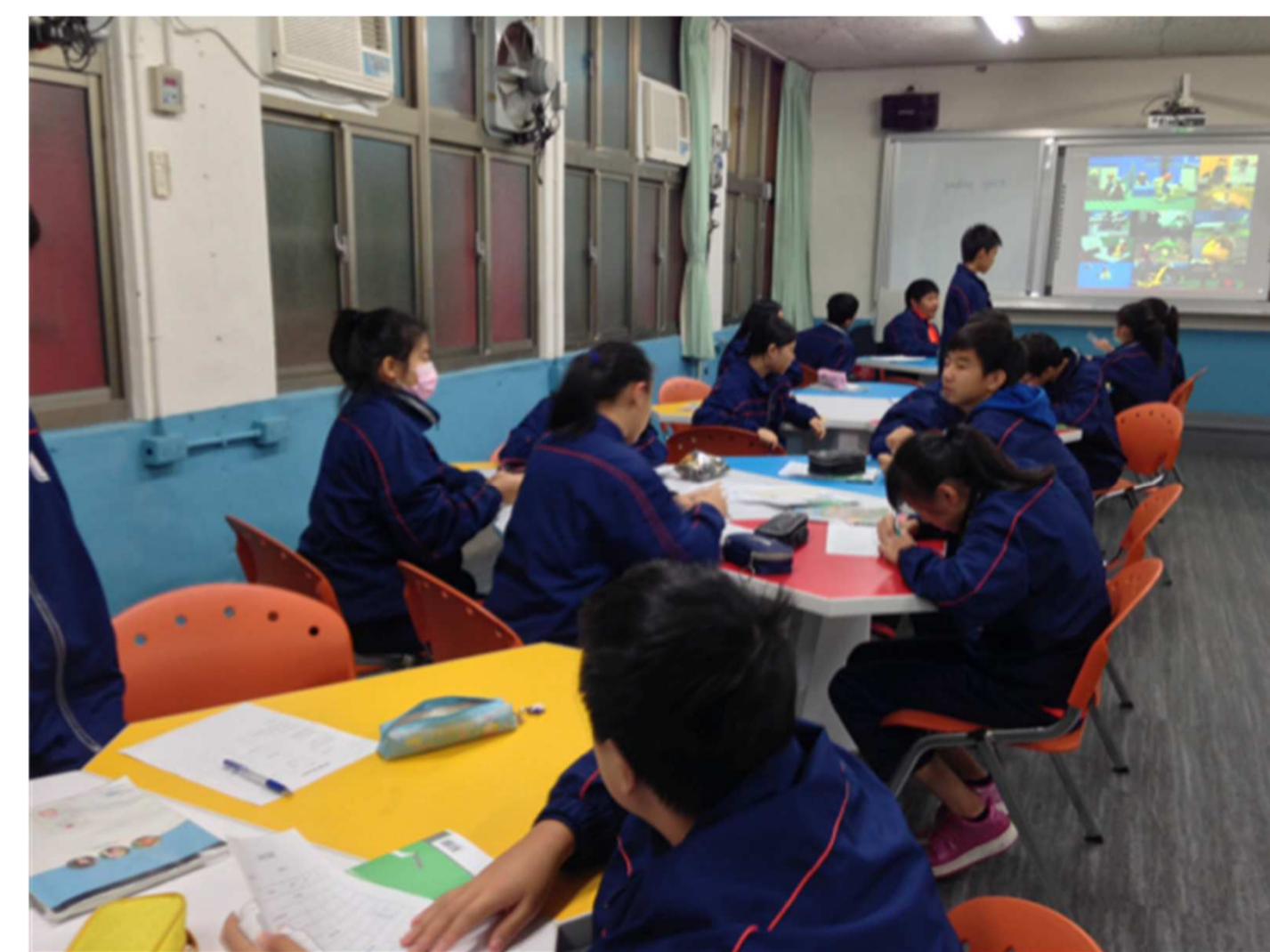
圖(左上) 兩人一組同儕指導