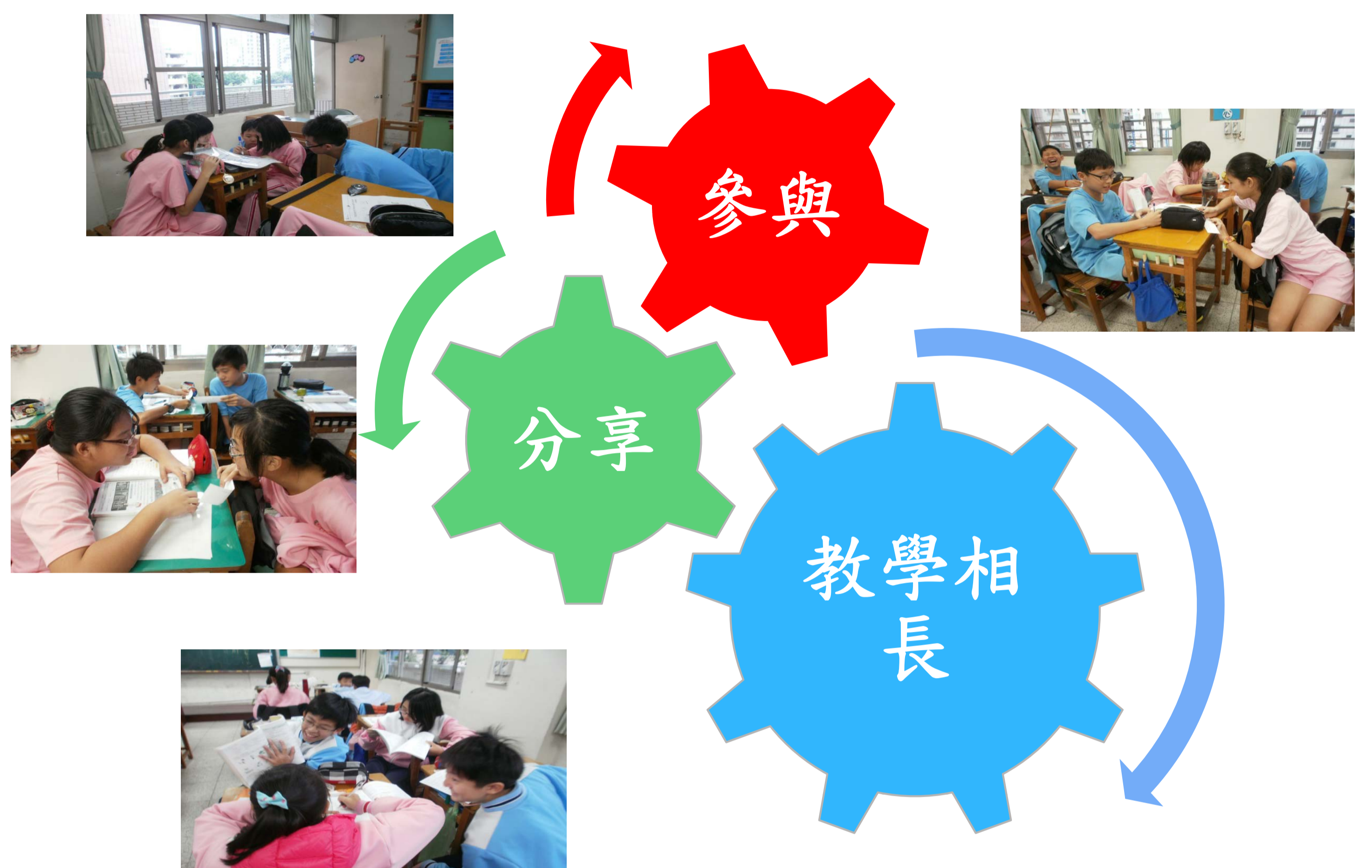
圖. 七年級實施「學習共同體」上課的情形

七年級老師共實施五次觀課、議課，八年級老師兩次觀課、議課，九年級老師兩次觀課、議課。每個年級的教學活動設計，各有一次是融入「生涯發展」議題。教師們共同備課，互相觀課，課後分享教學心得，討論改進辦法。