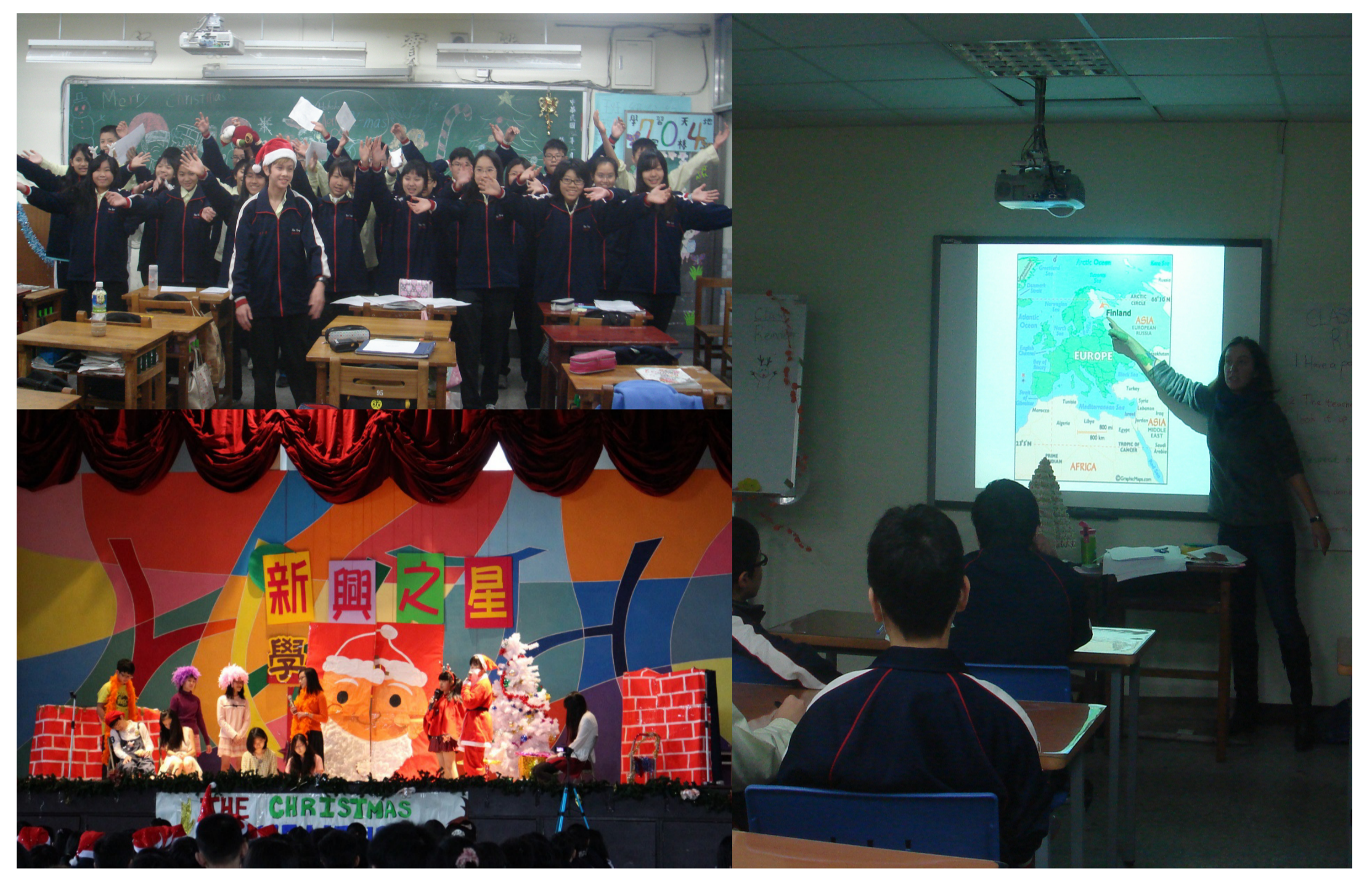
圖:動靜態教學成果及回饋