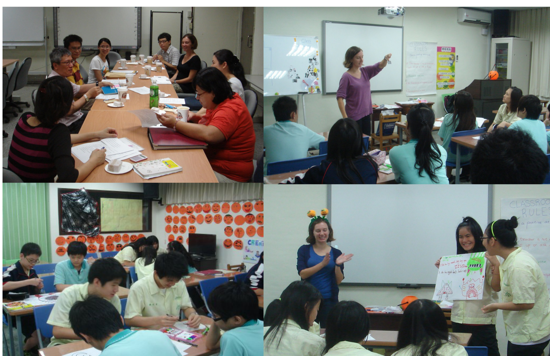
圖:教學研討及節慶教學活動