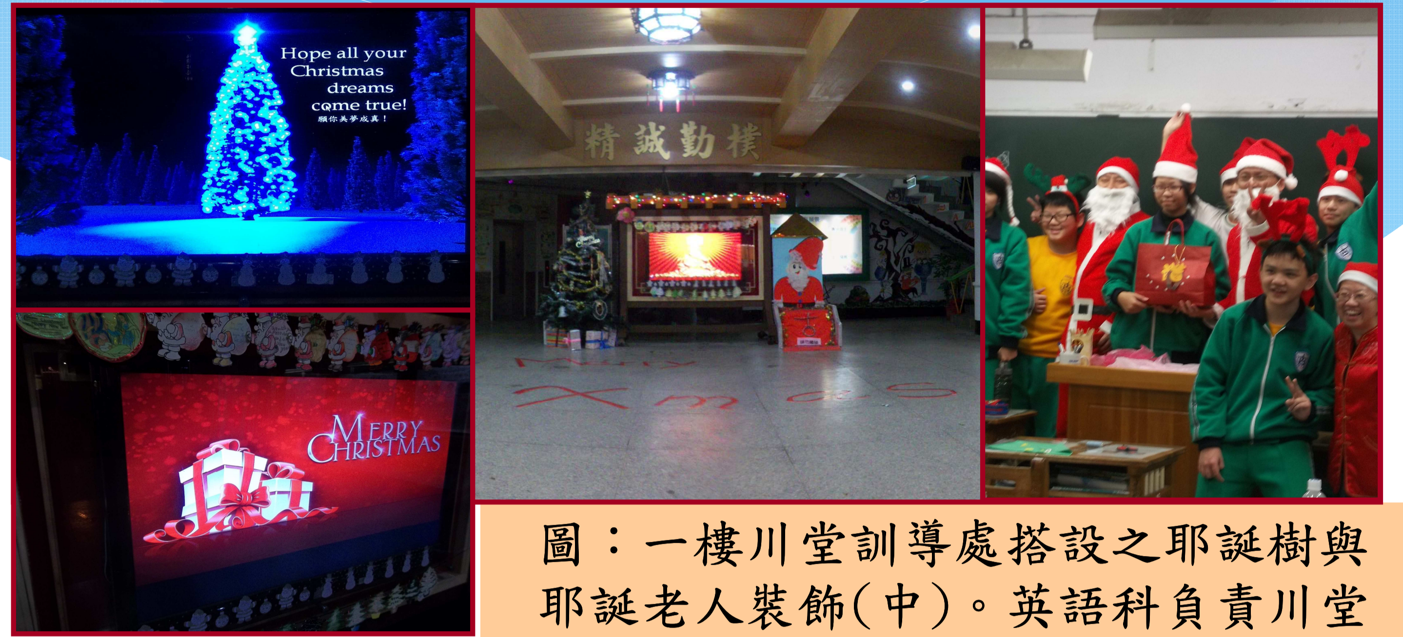
圖：一樓川堂訓導處搭設之耶誕樹與耶誕老人裝飾(中)。英語科負責川堂情境音樂與銀幕投影及佈置學生作品(左上與下)。校長與家長會長教室傳福音與學生合影留念(右)。

藉由製作節慶相關的卡片與書寫相關字句學習節慶相關的英語知識。同時藉由節慶裝飾及音樂等營造節慶的氣氛。