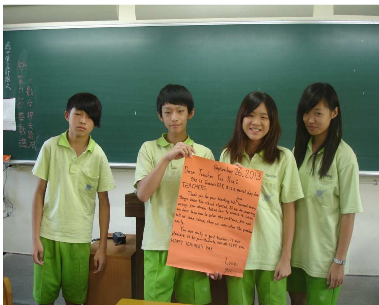
配合教師節製作書信海報

(一) 本學期加入各種不同的英語教學內容，期使學生能學習到正確的英語聽說讀寫，並由學生的作品展現出其學習意願及教師教學導向。 (二) 藉由共同備課時間，教師共同計教材、教案、講義，提高教學品質，得到正向的備課果。 (三) 學生在全英語的環境學習中，仍能盡情融入，互相學習，彼此協助，使學習達到事半功倍的加分效果。