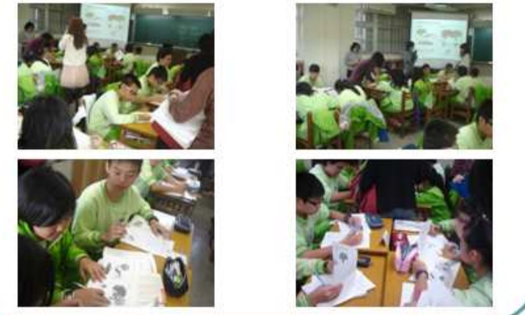
學習共同體觀課教學