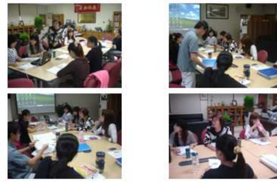
邀請學者蒞校指導教學活動