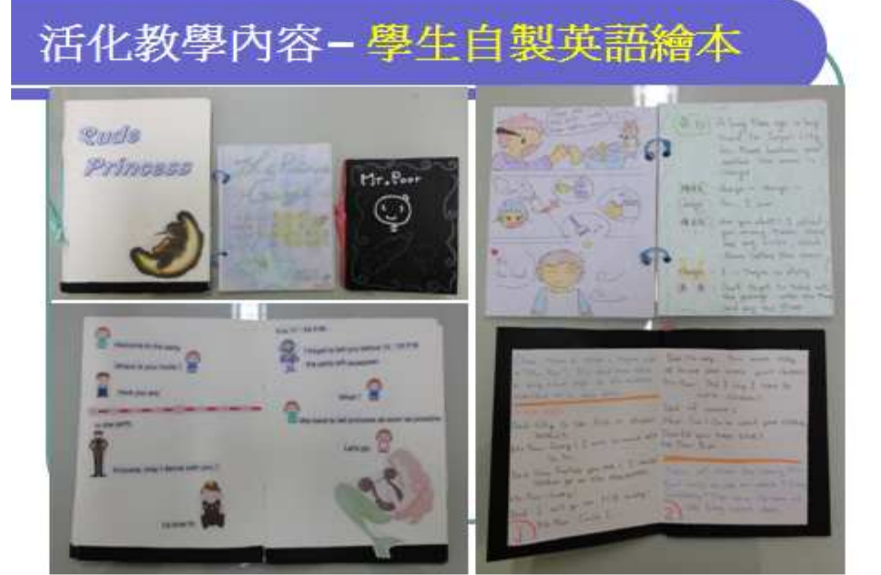
繪本教學小書製作