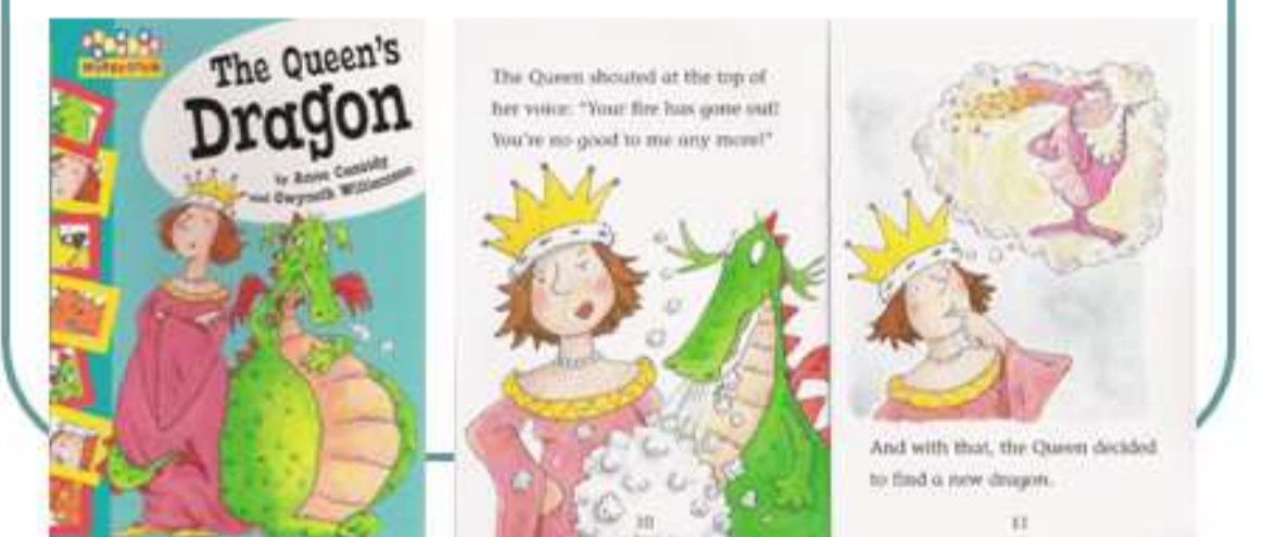
多樣化的英語繪本教學

由校方統一購書，學生以班為單位向圖書館借閱（每位學生皆有同一本繪本），再由教師設計教案及教材教學。