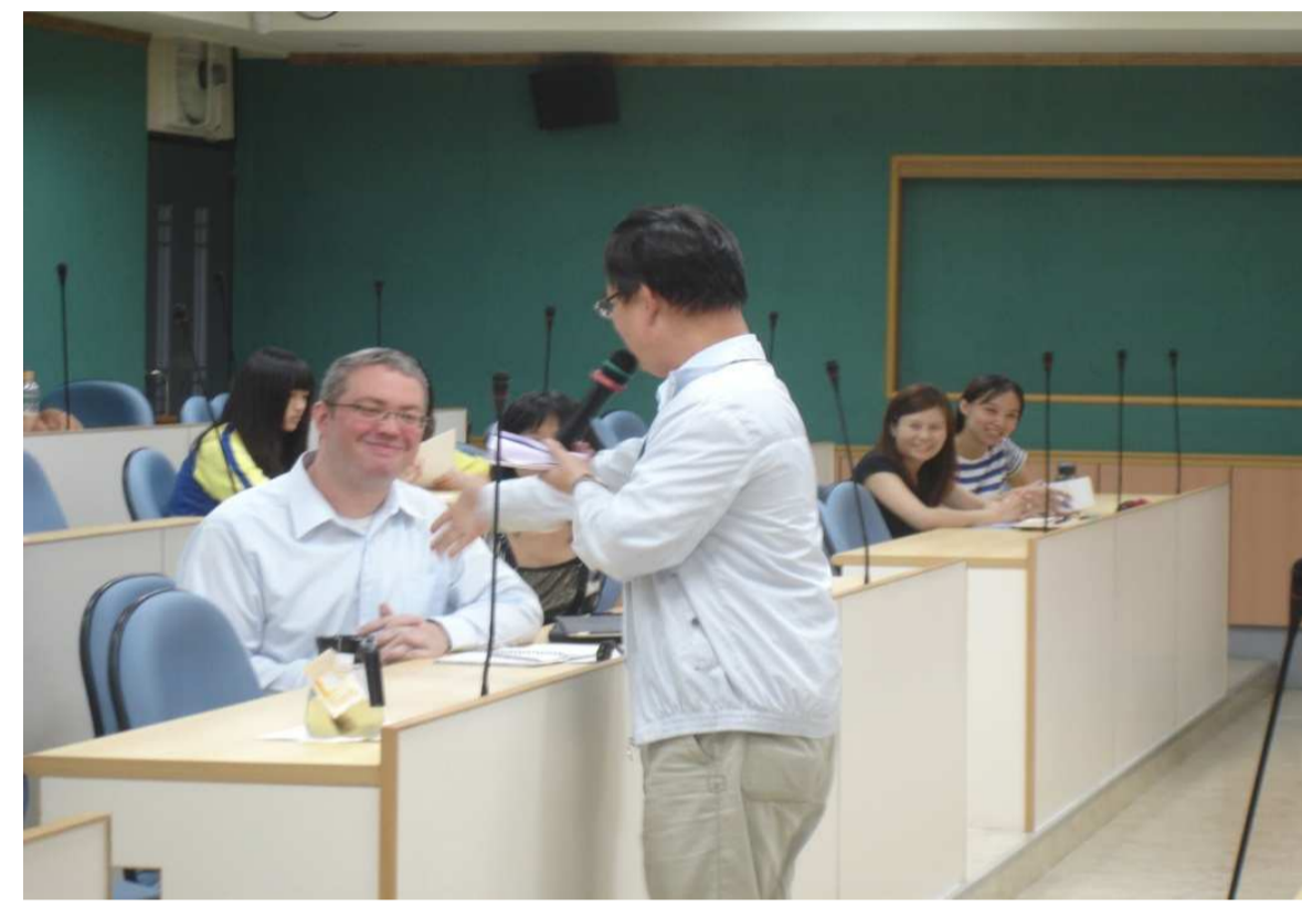
外師蒞校指導學生演講技巧