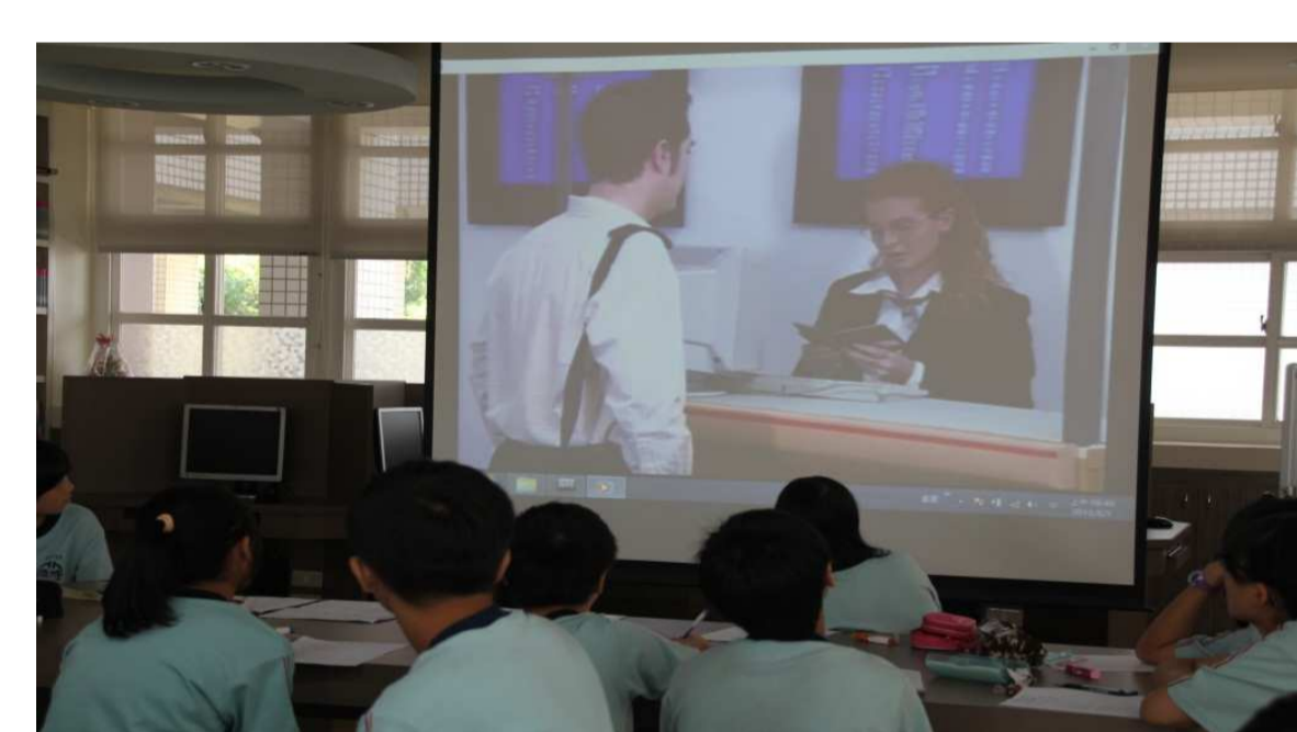
觀看旅遊情境影片