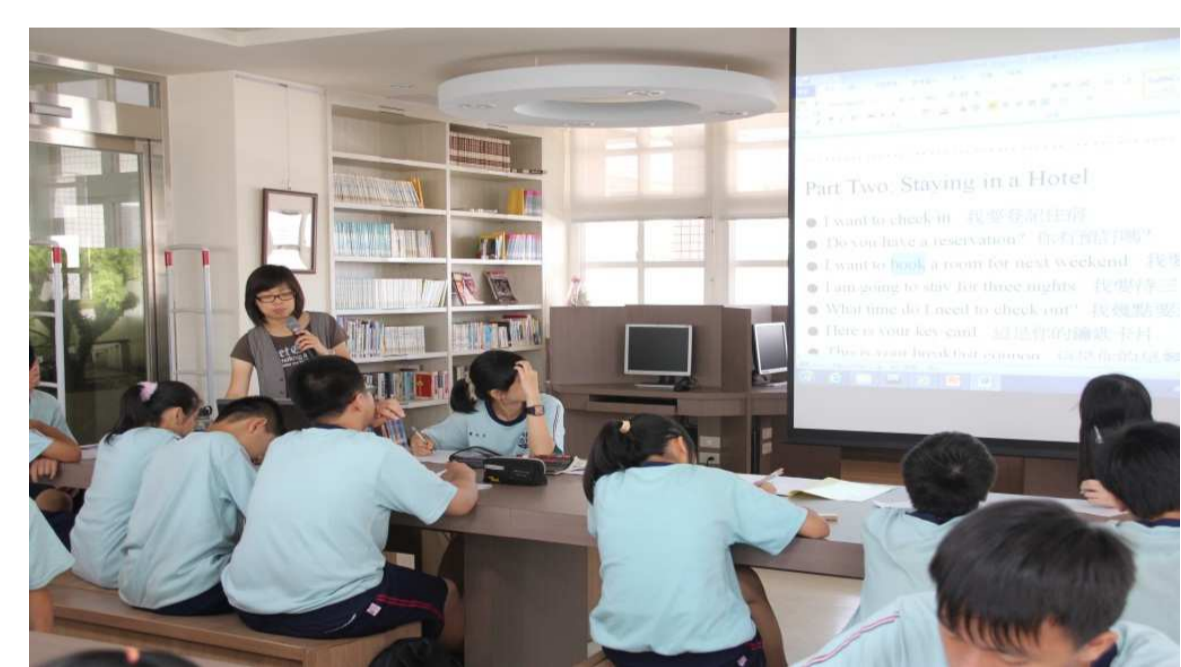
介紹旅遊英語實用句