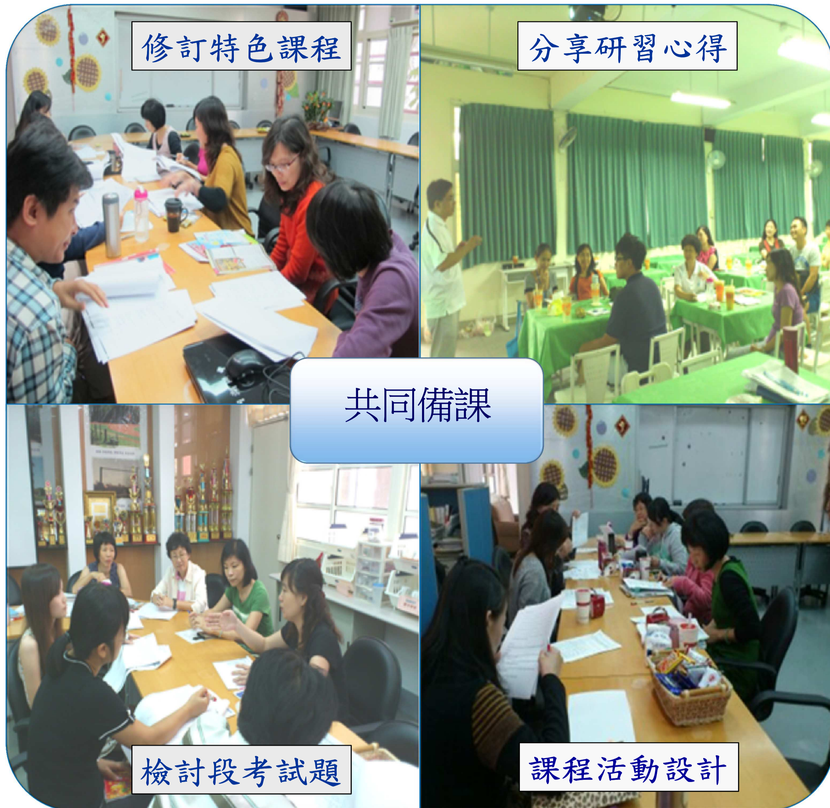
圖三. 內湖國中英語領域共同備課活動照片