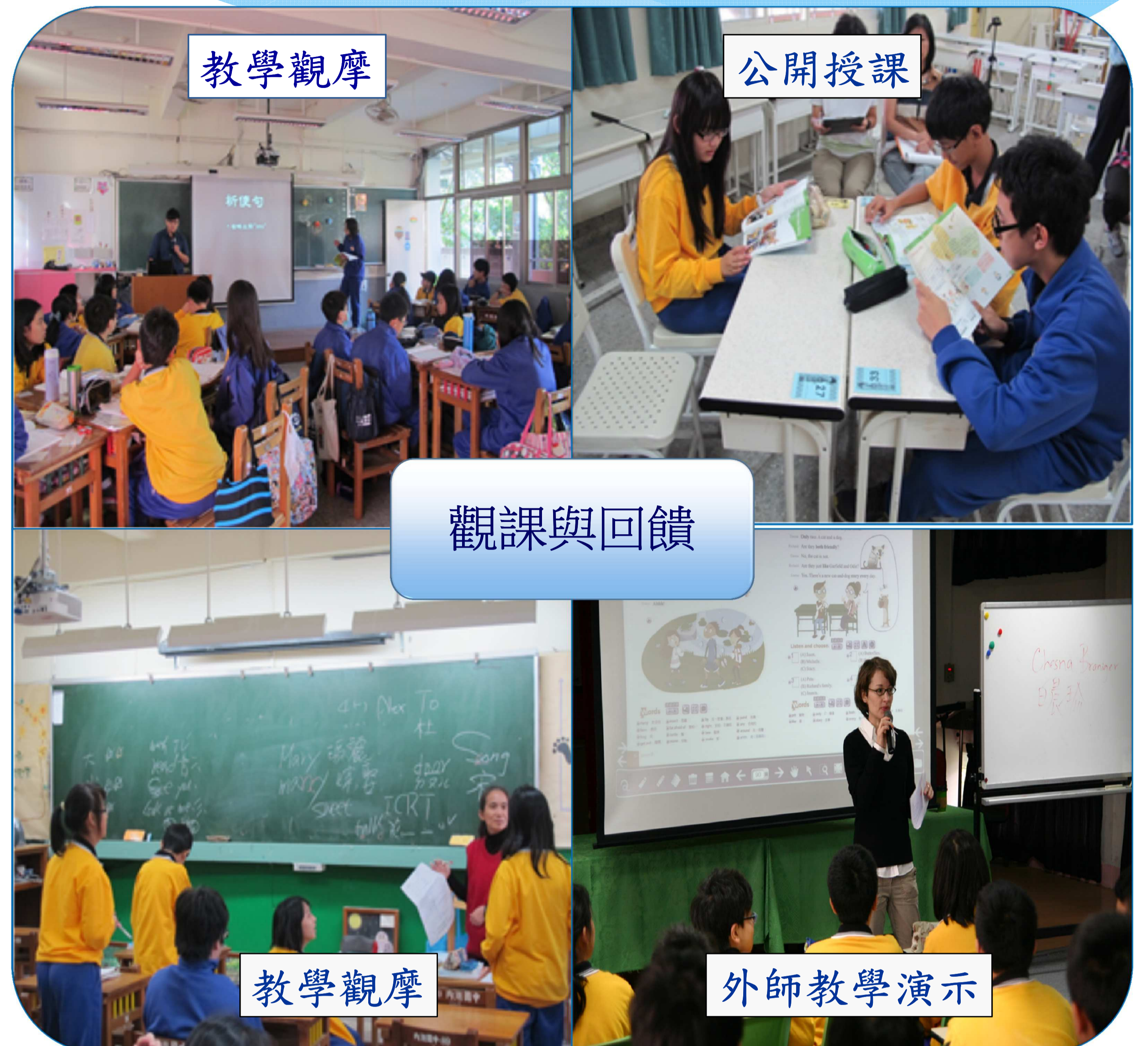
圖五. 內湖國中英語領域觀課活動照片