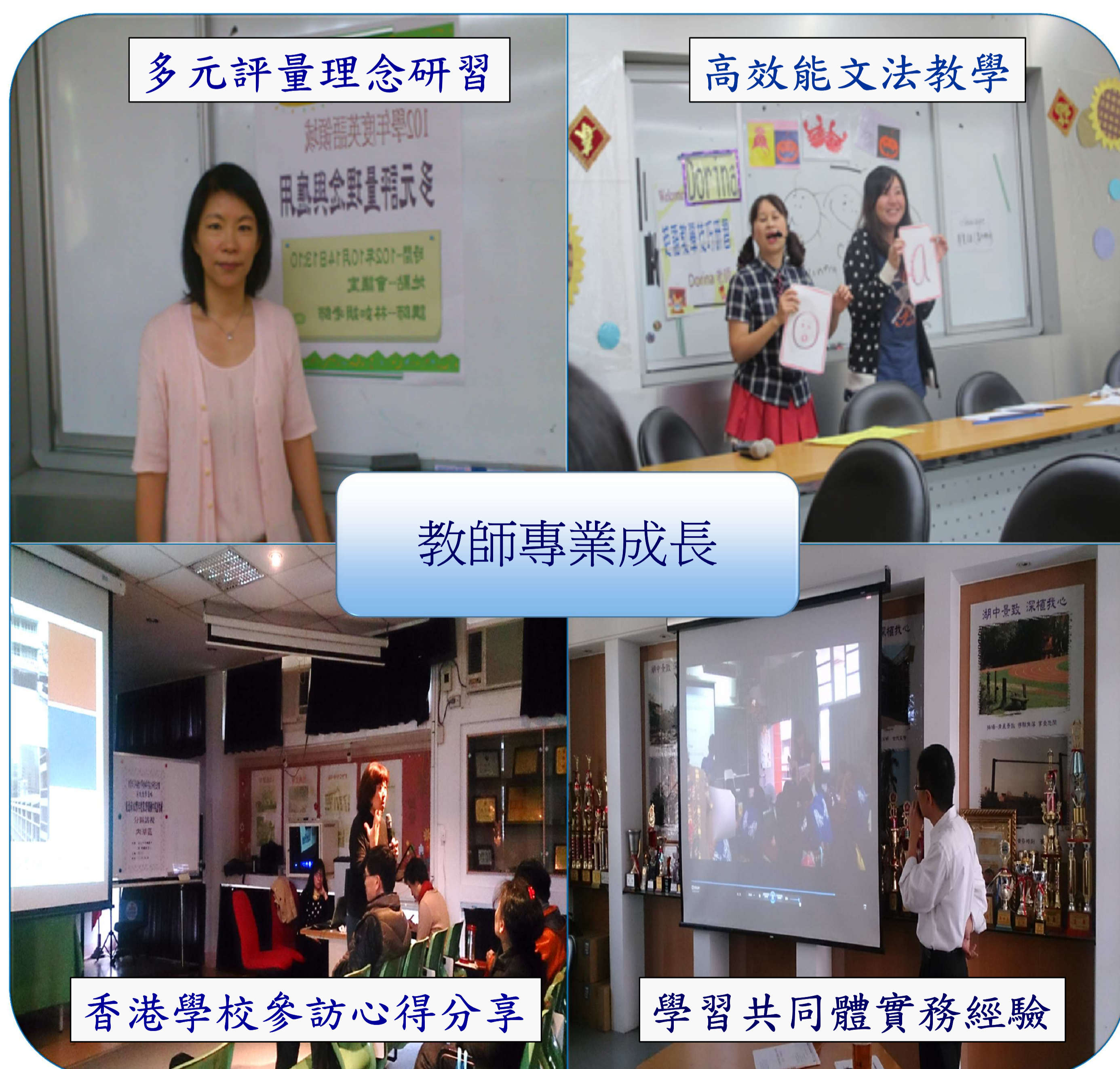
圖四. 內湖國中英語領域教師專業成長活動照片