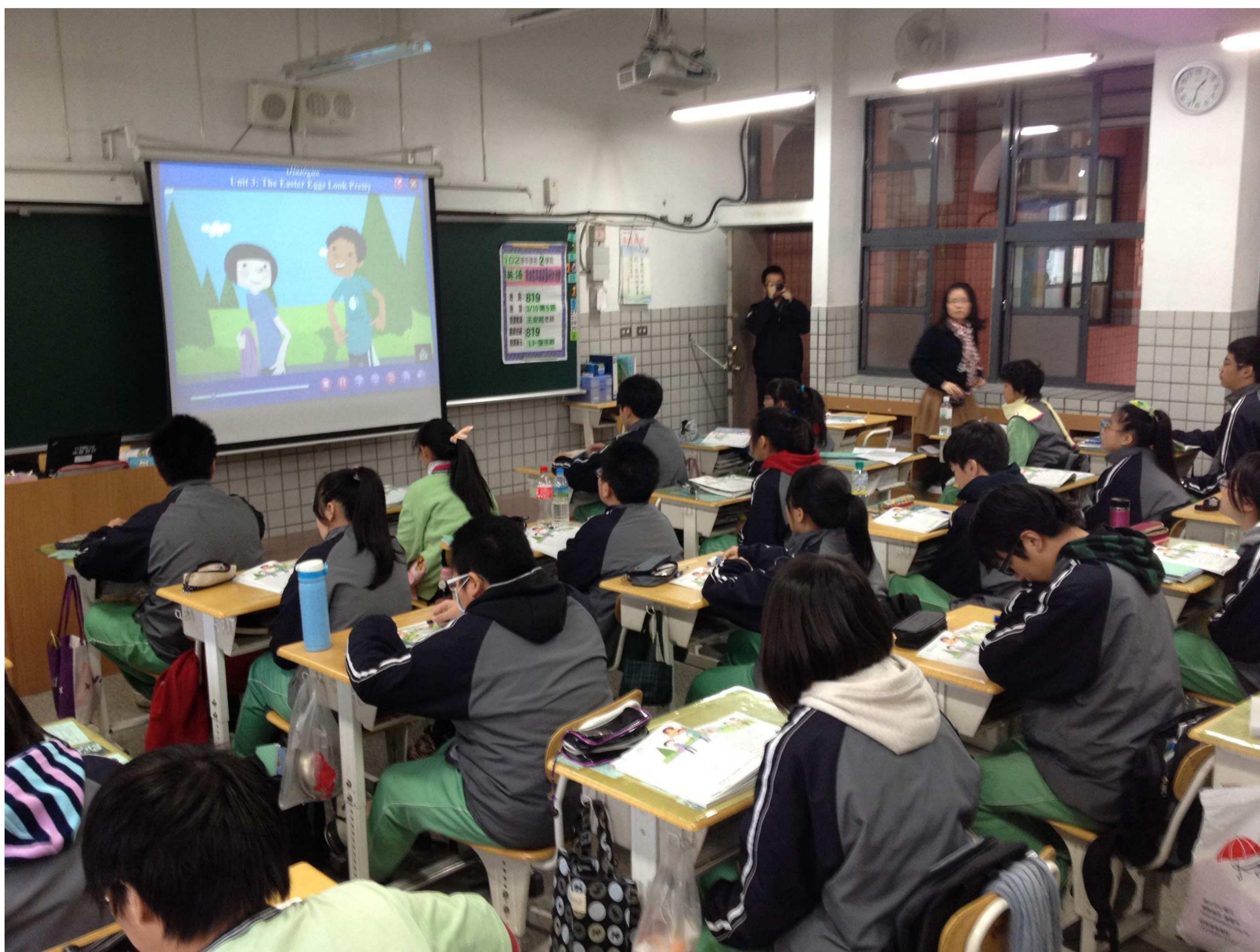
呈現學習材料，第一次先不用字幕