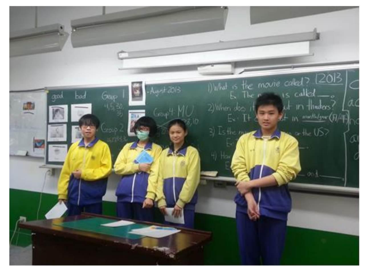
同學上台利用課本句型介紹電影