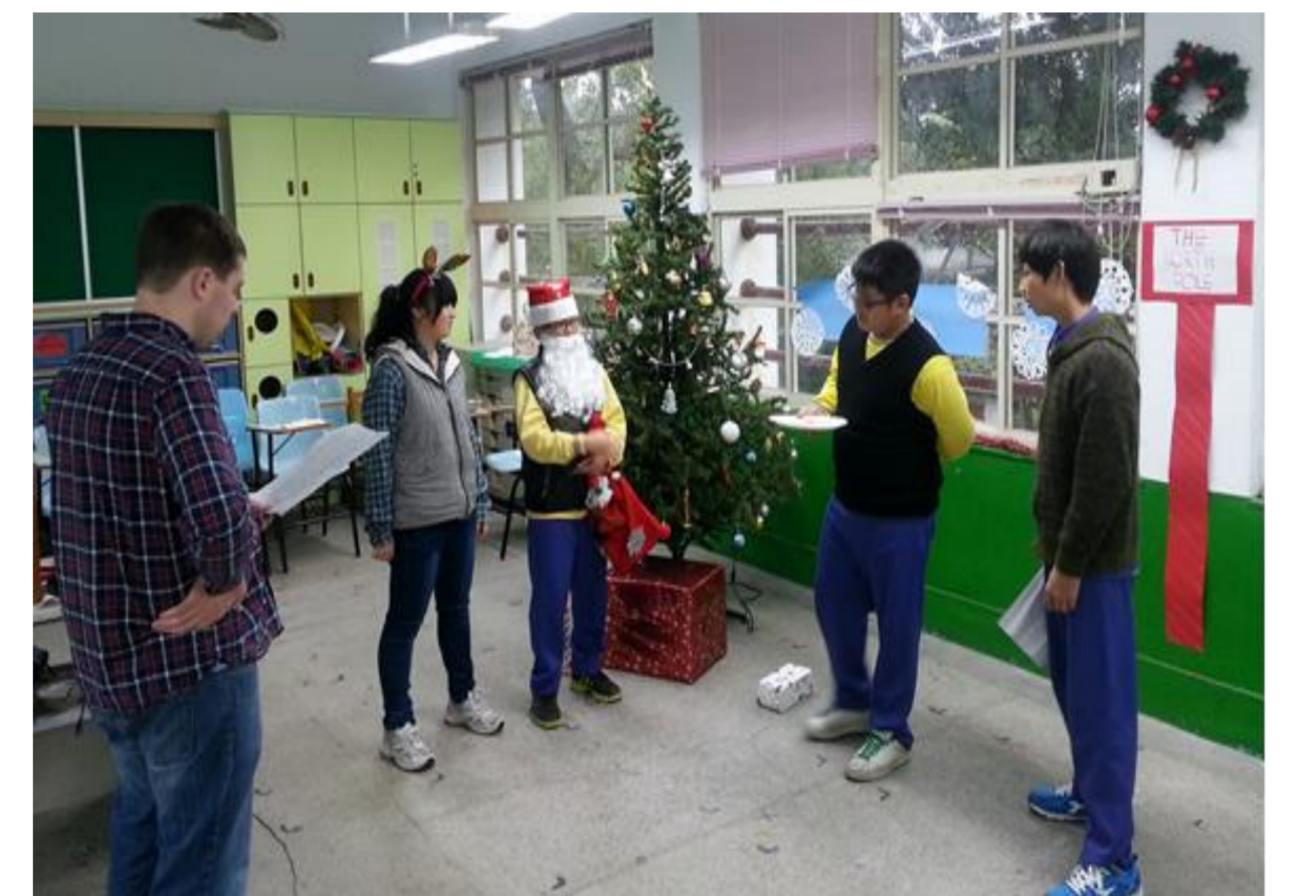
同學排演耶誕節小短片