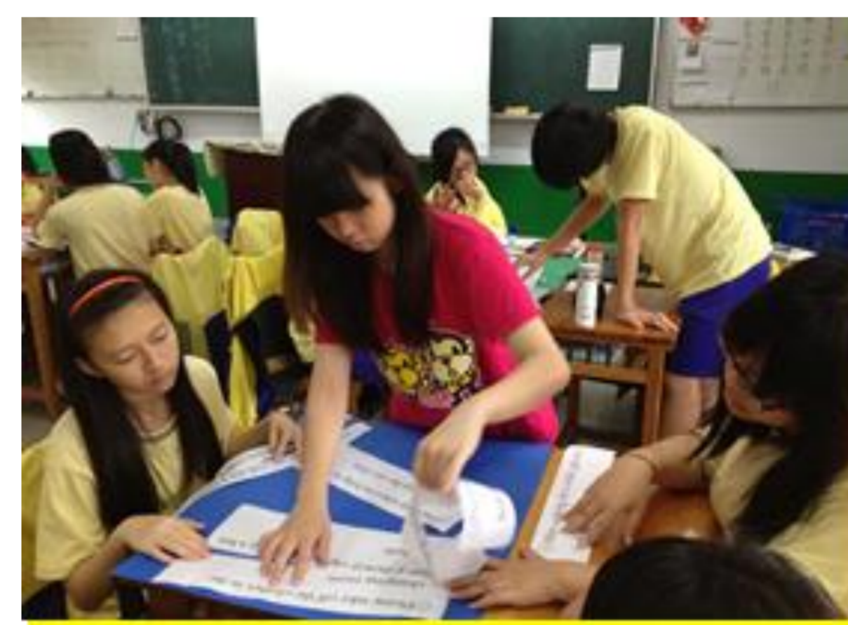
同學分組完成學習任務