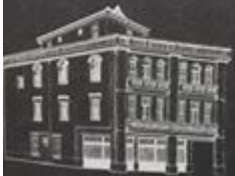
星巴克艋舺門市(萬華林宅) 台北市萬華區西園路一段306巷24號

位於艋舺大道、西園路口為市定古蹟的「萬華林宅」，隨著星巴克艋舺門市開幕，再次展現老宅風華魅力，走進門內，感受咖啡香氣氤氳，從一杯咖啡，感品味老建築背後的城市記憶。