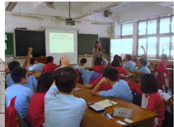
家庭教育融入課程檢核表