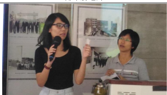
學員教師上台分享所蒐集到的資料