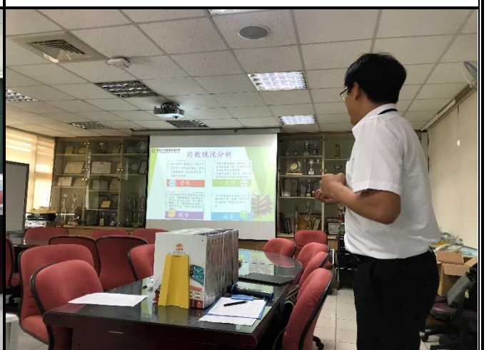
建廷校長報告民生國中特教現況分析