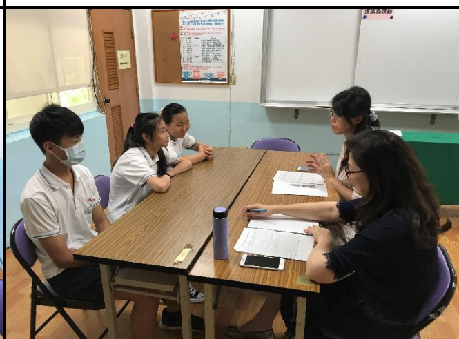
瑞蓉老師向三位學生代表提出問題