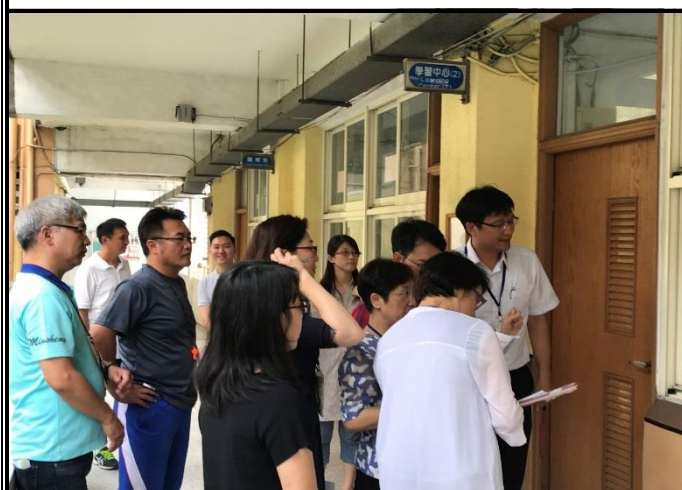
建廷校長帶領評委及老師們走察學習中心 (二)