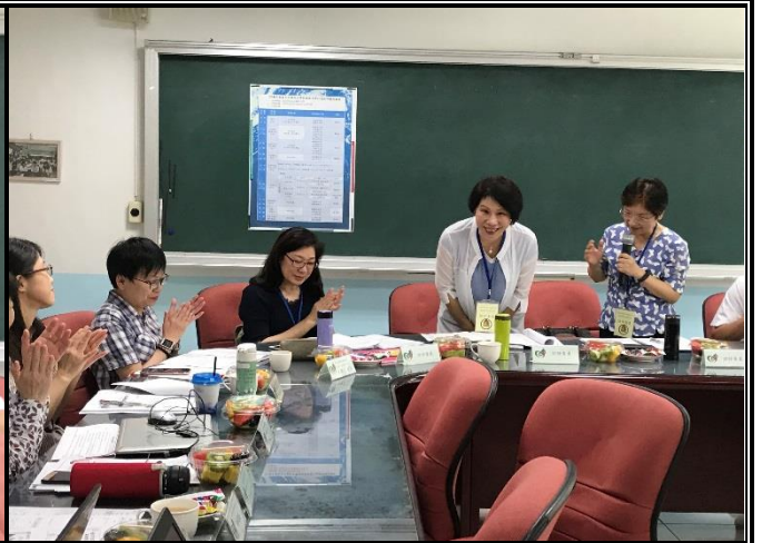
蓓莉教授逐一介紹訪評委員及國中特教輔導團評成員