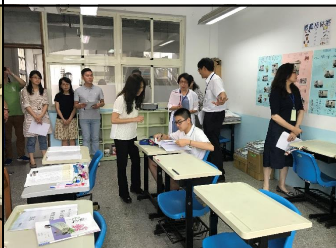
訪評委員觀察國文課老師與學生的教學 與互動