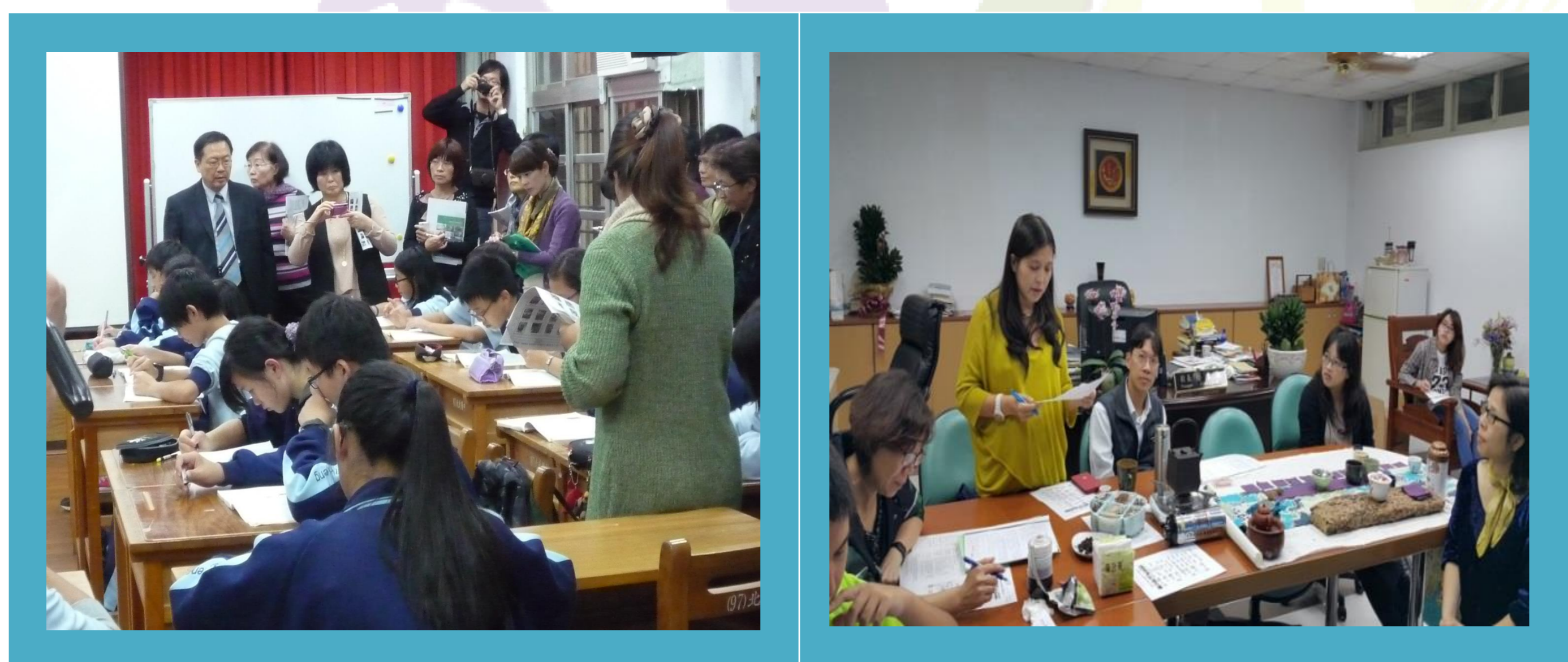
101學年度學習共同體第一次公開觀課邀請南韓孫于正教授蒞臨指導。

學校開始接觸學習共同體理念，舉辦讀書會、學習共同體理念研習，以了解學習共同體的基本概念。之後本校申請台北市學習共同體試辦學校，並派出三位老師到韓國考察。之後討論與設計學習共同體公開觀課的模式(包含觀課表、觀課三部曲的實施方式)，並舉辦第一場學習共同體公開觀課。在此時期，因到韓國參觀的老師為國文及自然領域，因此以這兩個領域開始嘗試學習共同體的課程設計與教學模式。