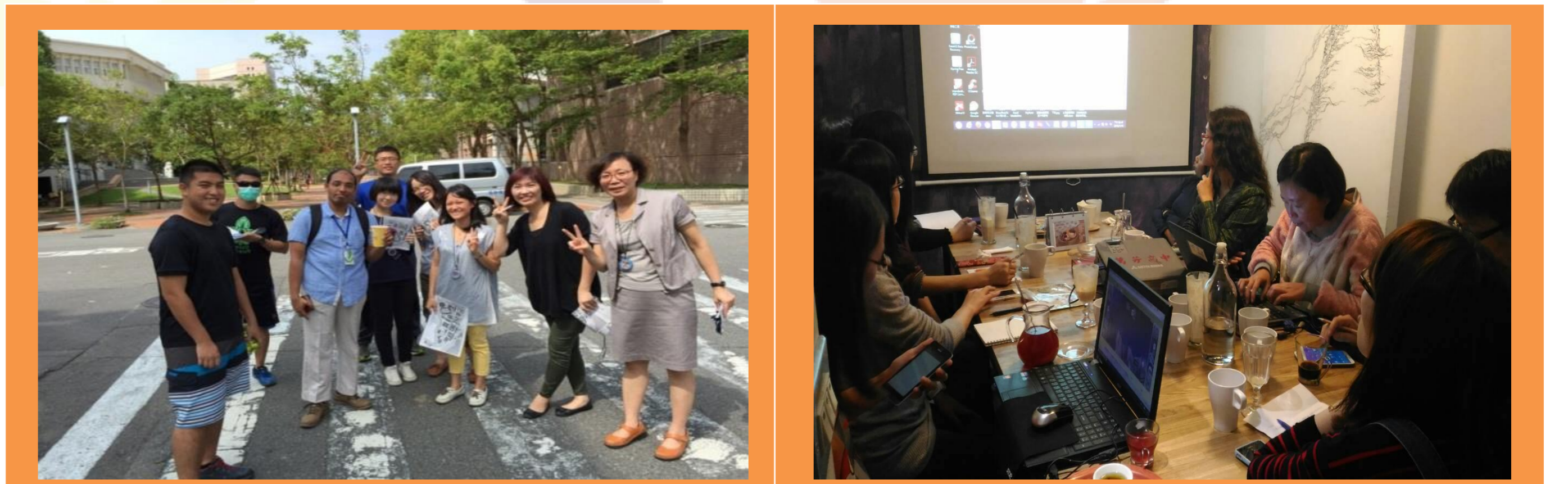
經過學共的滋養與課程發展逐漸成熟，開始結合本校特色與重要議題，籌組跨領域社群，發展課程地圖。