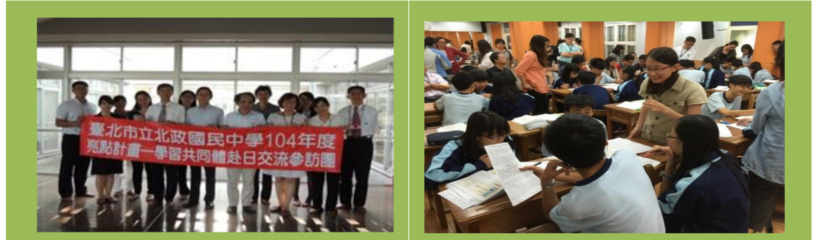
本校教師獲得亮點計畫挹注，赴日參訪學習共同體。

在學習共同體推展兩年之後，本校拿到台北市「103學年度亮點計畫」，學校教師開始思考與討論「北政國中的學生未來需要具備的能力」，並且希望以能力為導向，結合本校特色，討論本校教師與行政樣態、聚焦北政國中學生學習情形、開始建構本校特色課程模組。另外在六月份時帶領本校八位老師到日本參觀學習共同體學校，看見學生傾聽及討論的氛圍，以及師生和諧和教師課堂串連的能力，都令此趟參訪的老師感動不已，也更堅定學校進行課程改革與翻轉學教的決心。