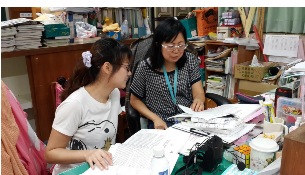
忙碌中撥空讀書與討論