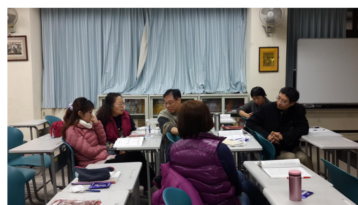
夥伴投入於問題討論