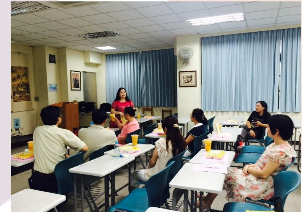
各章節主講人分享心得及主持討論