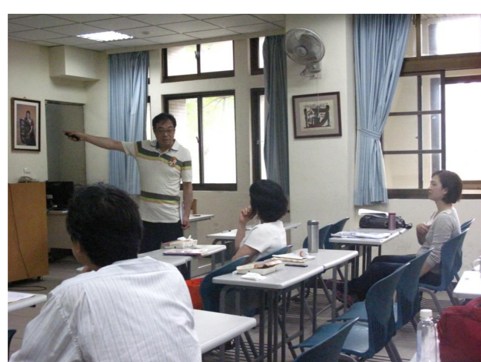
主講人賣力分享心得