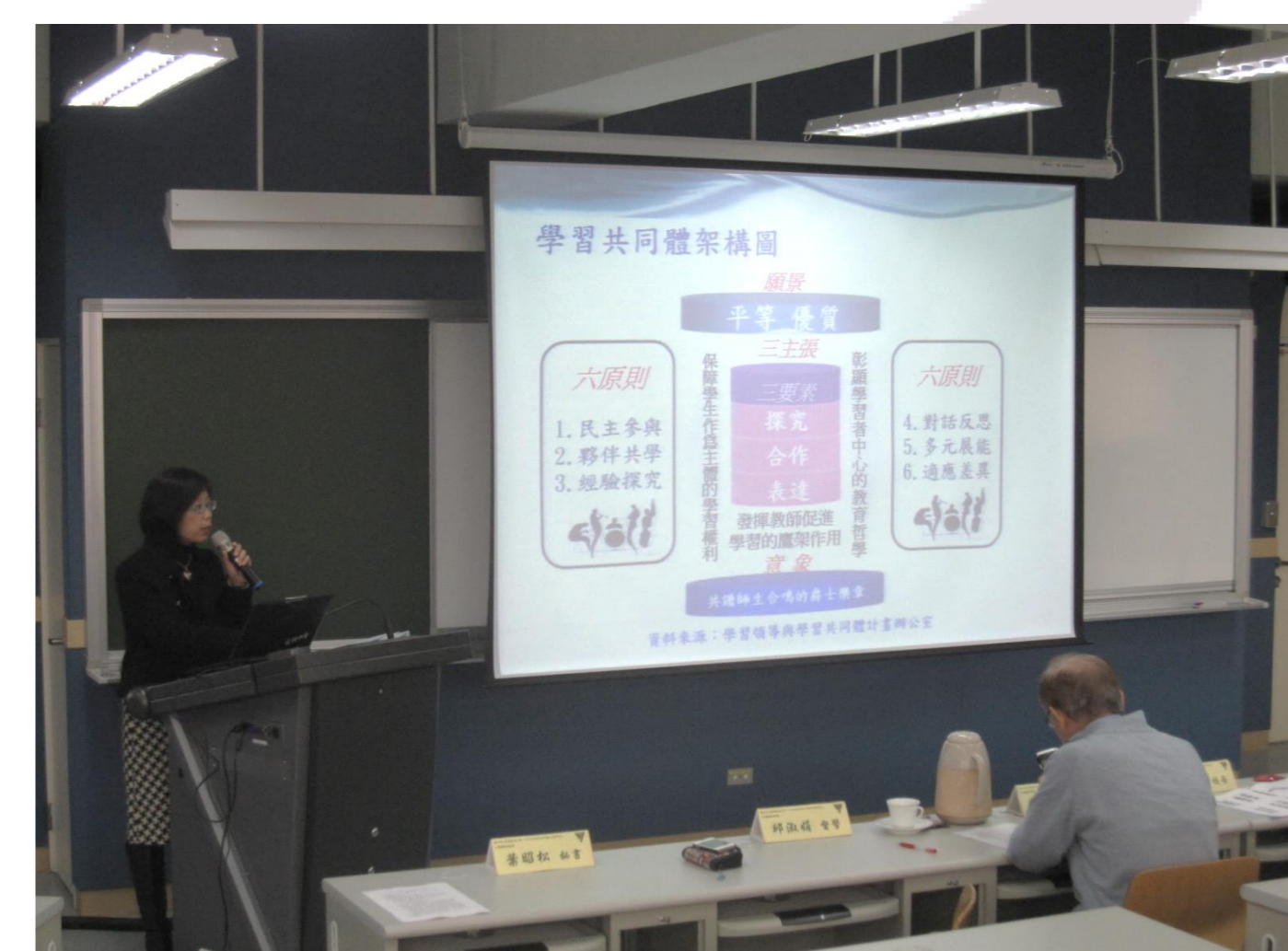
校外專家進行學共說明