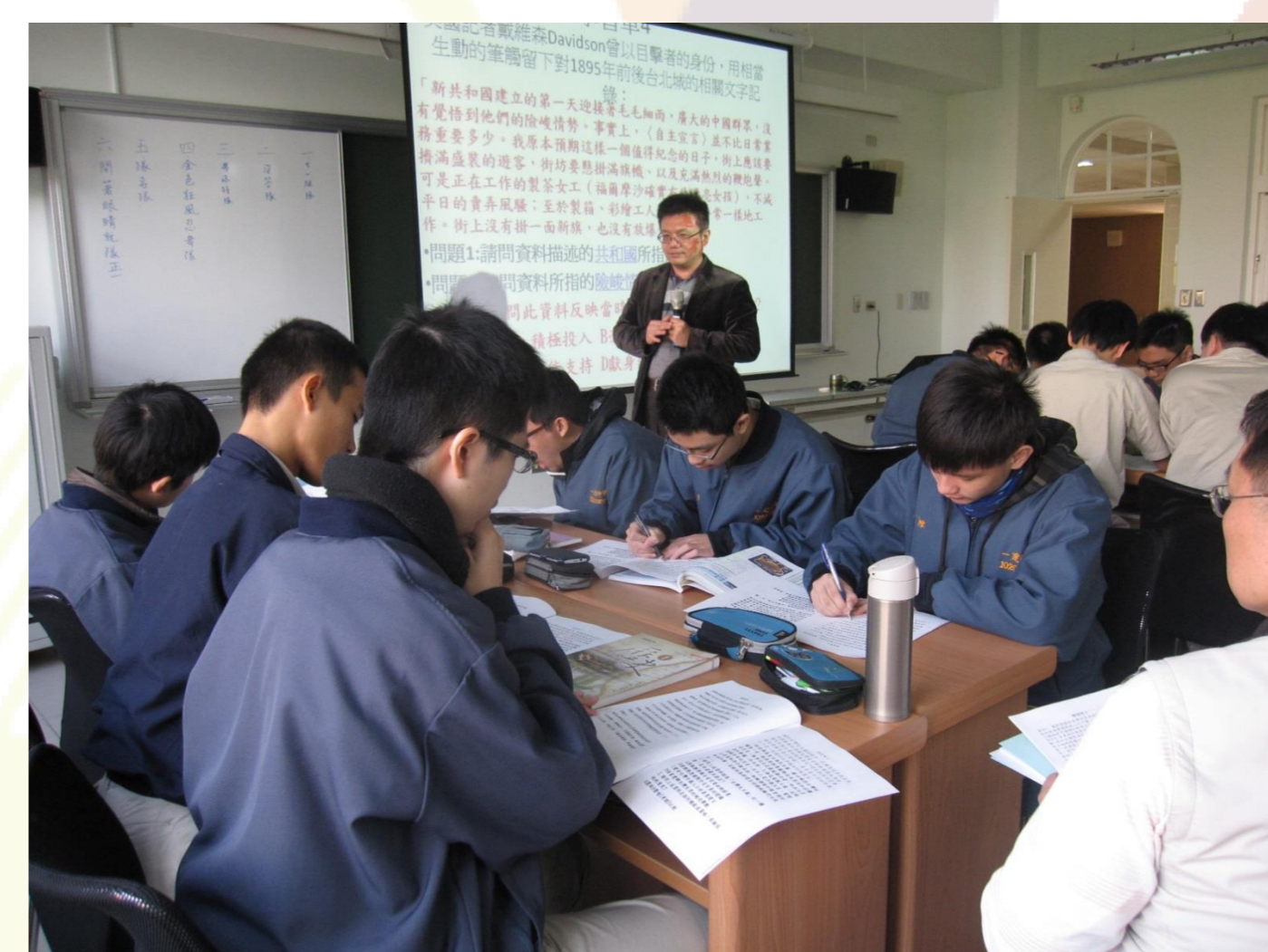
教師進行學共授課