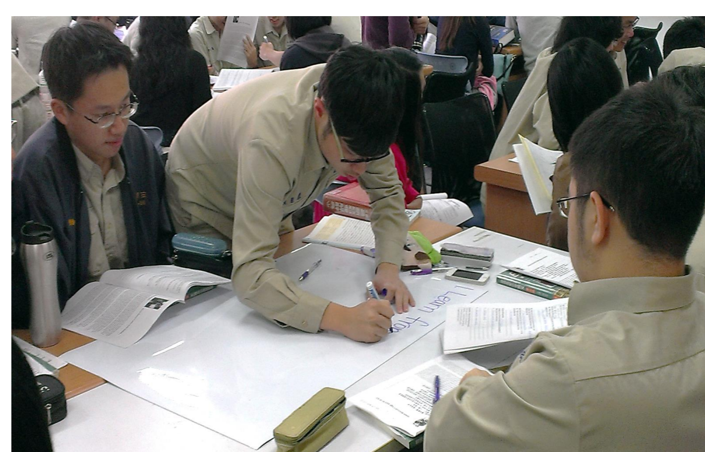
同學於小組內紀錄討論重點