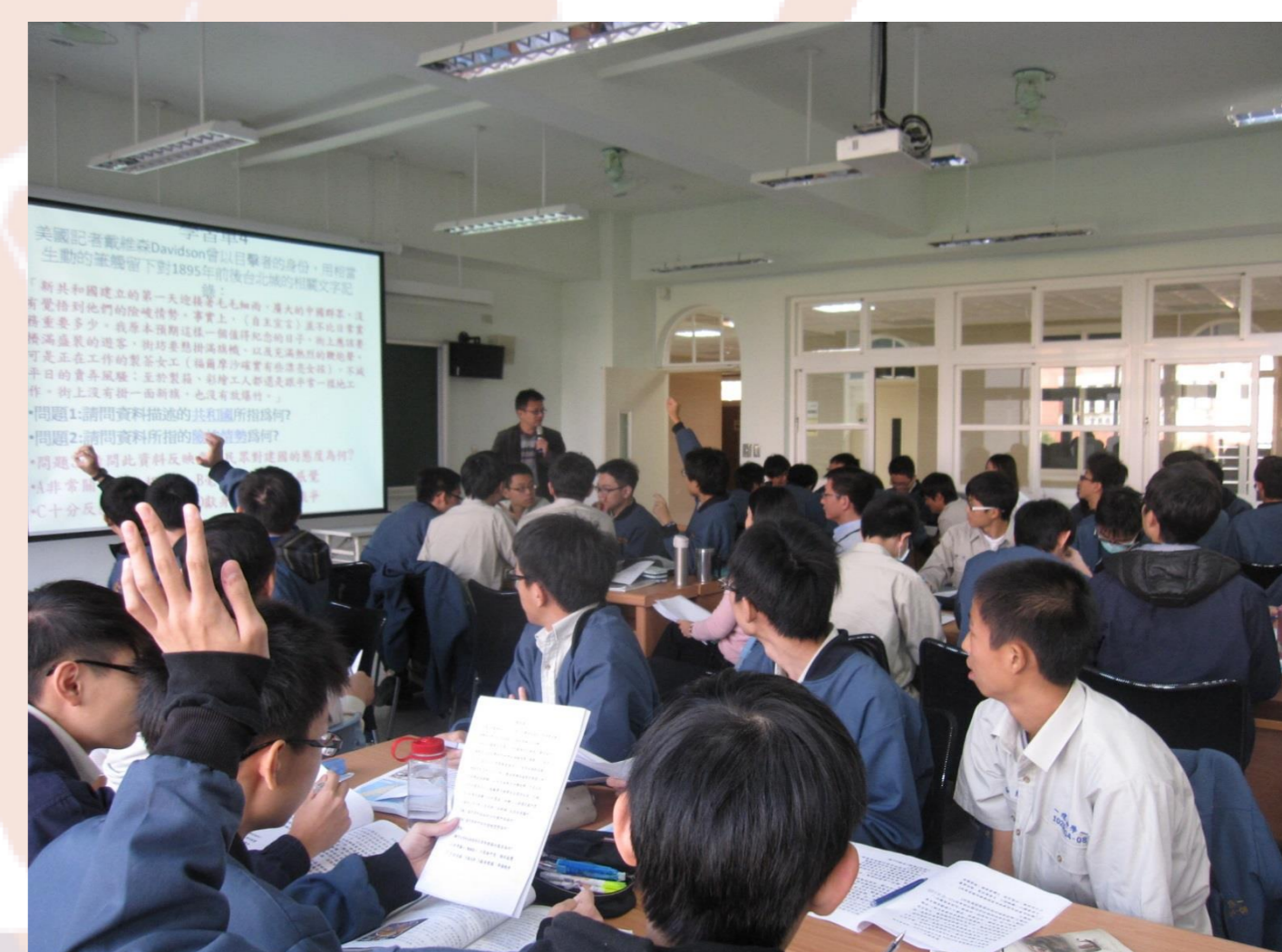
小組積極回答討論問題