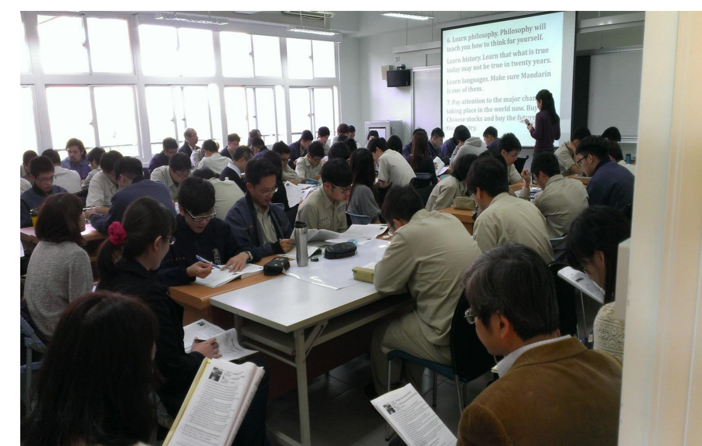
教師進行學共授課