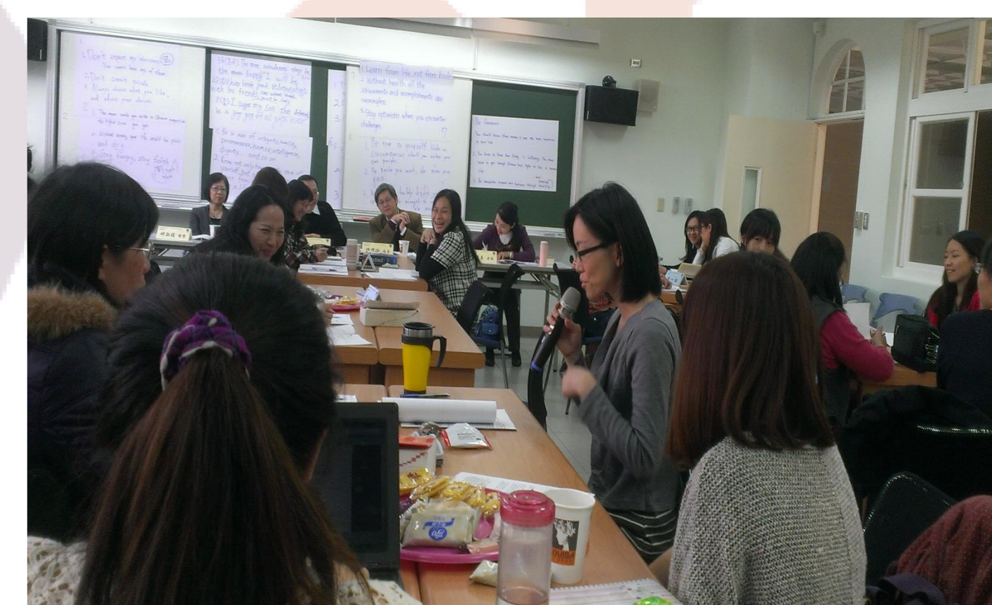
校內外教師參與議課