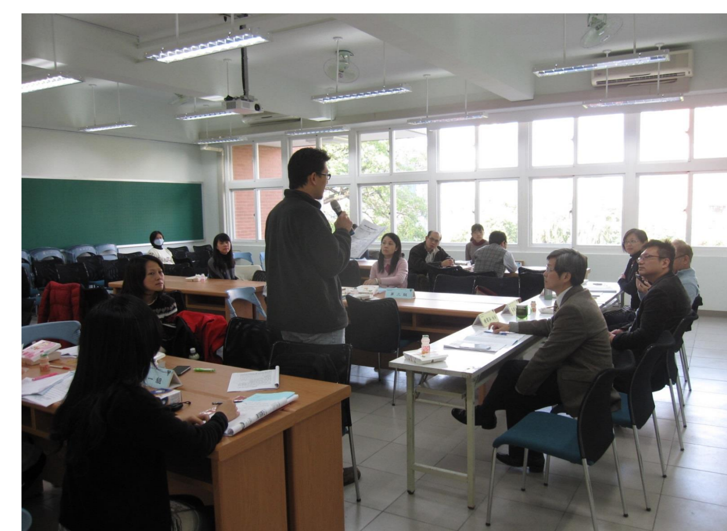
校內外教師、校長、專家共同議課

■ 指導單位：教育部 ■ 主辦單位：學習領導下中小學學習共同體之規劃與推動計畫辦公室、臺北市教育局 ■ 協辦單位：臺北市立長安國中